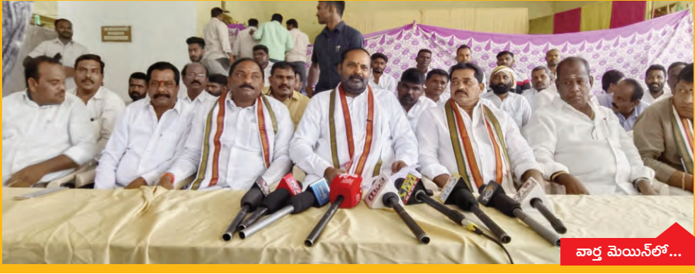
వార్త మెయిన్ లో...