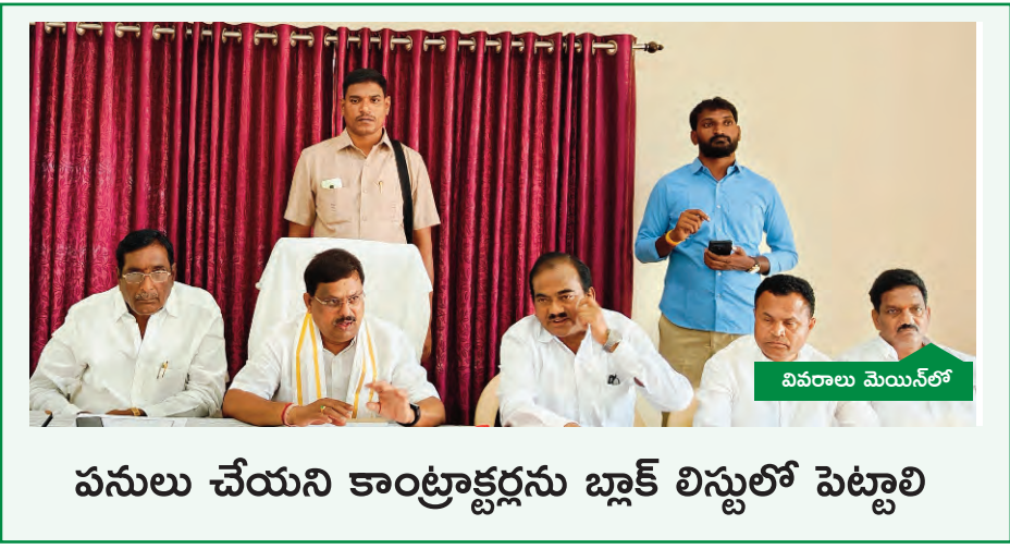
పనులు చేయని కాంట్రాక్టర్లను బ్లాక్ లిస్టులో పెట్టాలి