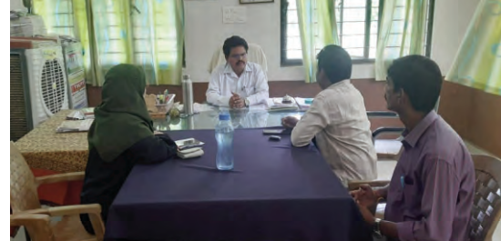
రెండు సంవత్సరాలు పై బడిన 19 సంవత్సరాలు లోపు వారికి పూర్తి స్థాయి మందు గోలి వేస్తామని పేర్కొన్నారు. ఈ మందు గోలి పాఠశాల లోనే నమిలి మింగాలని ఇంటికి తీసుకెళ్లకూడదని వైద్యులు పేర్కొన్నారు. కావున జాతీయ నులి పురుగుల దినోత్సవం అధికారులు సిబ్బంది సహకరించి విజయవంతం చేయాలని కోరారు.