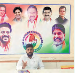
బూర్గంపాడులో బక్రీద్ పండుగ సందర్భంగా