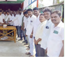
పండ్లగొండలో భట్టి పుట్టినరోజు వేడుకల సందర్భంగా