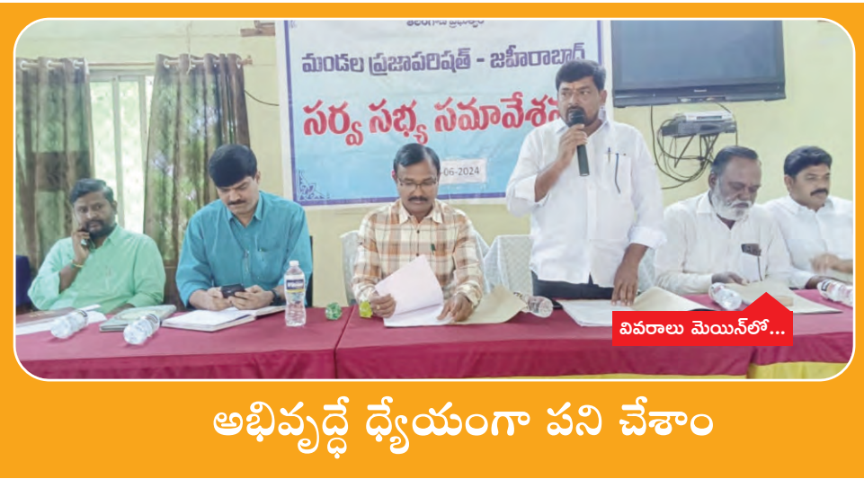
అభివృద్ధి ధ్యేయంగా పని చేశాం