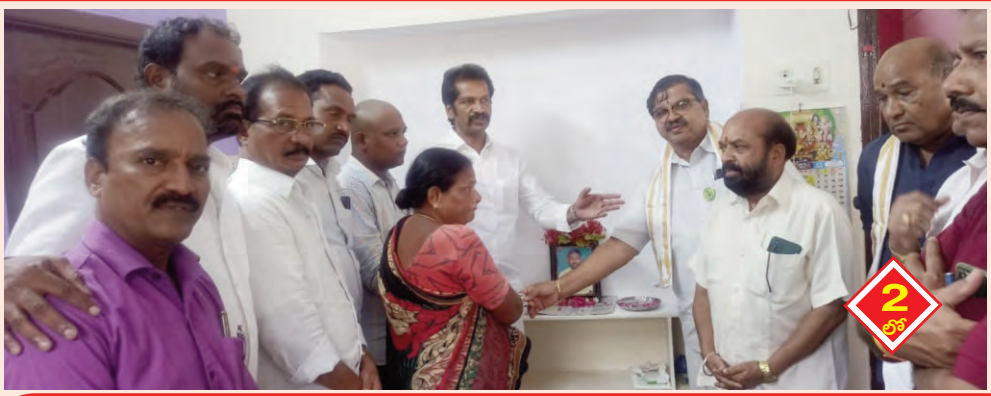
చేనేత సమస్యలపై సిఎం దృష్టికి తీసుకెళ్తాం