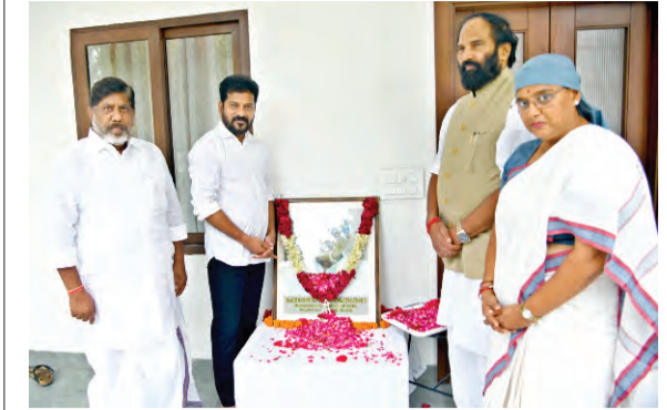
సంస్కరణలతో దేశ ప్రగతిని పరుగులు పెట్టించిన పివి ముఖ్యమంత్రి రేవంత్ రెడ్డి