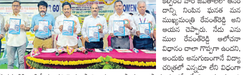
చేసినప్పటికీ ఆ డిగ్రీ వల్ల సరియైన ఉపాధి అవకాశాలు లభించడం లేదని ఆయన చెప్పారు. ప్రపంచానికి సరిపోయే నైపుణ్యాలు మీలో ఉన్నాయని, మీరు ఏ లక్ష్యాలను సాధించాలని అనుకుంటున్నారో ఆ లక్ష్యాలను అనుగుణంగా మీ నైపుణ్యం అభివృద్ధి చెందజాలాలి, నిర్లక్ష్యం చేయబడకండి, కోలుకోలేని విధంగా గత పది సంవత్సరాలా మన భవిష్యత్తును సైతం పడేసింది అని ఆయన ఆవేదన వ్యక్తం చేశారు. విశ్వవిద్యాలయాల 80 అపైస ట్రీడ్ లో శిక్షణ ఇవ్వగల మని అందుకే విద్యార్థులకు నాణ్యమైన విద్యను అందించడమే లక్ష్యంగా ముందుకు వెళుతున్నామని ఆయన చెప్పారు. ఎన్నడూ లేని విధంగా అధికంగా వస్తున్నారని, విద్యార్థులు డిగ్రీ పూర్తి