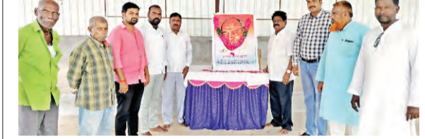
ఆర్థిక సంస్కరణలకు ఆద్యుడు పివి ముఖ్యమంత్రి రేవంత్ రెడ్డి