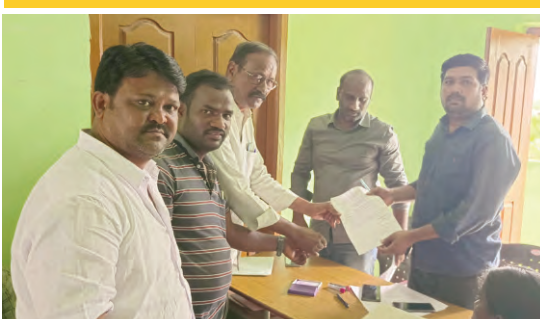
- ప్రజాపక్షం కథనాలను జతచేసి అధికారులకు వినతి సీపీఎం, కాంగ్రెస్ ఆధ్వర్యంలో కట్టపై వినతి