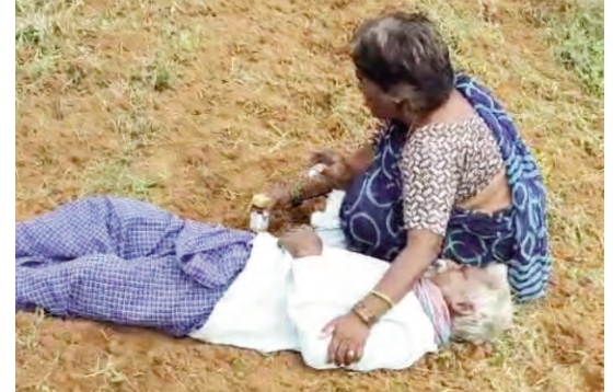
ప్రశ్నిస్తున్నారు. పచ్చిపాల భద్రయ్య భూమి కట్టా వ్యవహారంలో మండల అధికారుల హస్తం ఉందని వెంటనే వారిపై చర్యలు తీసుకోవాలని ఈ మొత్తం వ్యవహారం పై విచారణ జరిపించాలని కోరుతున్నారు.

(మొదటిపేజీ తరువాయి) నాయక్ భూమి మధ్యలో భద్రయ్య భూమి ఉండడంతో భద్రయ్య భూమిని కూడా తన భార్య పేరు పై పట్టా చేయించుకున్నాడు. ఈ భూ కట్టా విషయమై భద్రయ్య అధికారులకు ఫిర్యాదు చేయడంతో పాటు భద్రాచలం మొబైల్ కోర్టును ఆశ్రయించి కోర్టు నుంచి ఇంజక్షన్ ఆర్డర్ తీసుకు వచ్చాడు. ఈ ఆర్డర్ కాపీని పోలీస్ స్టేషన్లో సమర్పించిన తర్వాత కూడా ఆయనకు ఎటువంటి ఫలితం దక్కలేదు. దీంతో తీవ్ర మనస్తాపానికి గురైన భద్రయ్య పురుగుల మందు సేవించి ఆత్మహత్యాయత్నానికి పాల్పడ్డాడు. భద్రయ్యను ఇల్లందుకు ఆ తర్వాత ఖమ్మం ఆసుపత్రికి తరలించారు. రెవెన్యూ వ్యవస్థలో కొందరు అధికారులు మండలంలోని గిరిజనేతర రైతులను బెదిరించి ఇటువంటి దుశ్చర్యలకు పాల్పడుతున్నారన్న ఆరోపణలు వినవస్తున్నాయి. 1/70 చట్టాన్ని చూపుతూ గిరిజనేతర రైతులను రెవెన్యూ అధికారులే బెదిరిస్తున్నారన్న ఆరోపణలు వినవస్తున్నాయి. భద్రయ్య భూమి విక్రయించకుండానే ఎలా ఇతరుల పేరున భూ రికార్డుల్లో నమోదు చేశారని మండల రైతులు