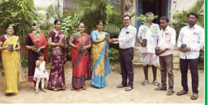
పంపిణీ చేశారు. ఆ మొక్కలను ఇంటి పరిసరాలలో నాటి సంరక్షించాలని సూచించారు. ఈ కార్యక్రమంలో పంచాయతీ కార్యదర్శులు, ప్రజలు, తదితరులు పాల్గొన్నారు.