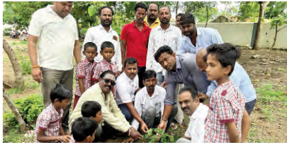
ప్రజాపక్షం/తానూర్: భారతీయ జన సంఘ వ్యవస్థాపక అధ్యక్షులు డాక్టర్ శ్యామ్ ప్రసాద్ ముఖర్జీ 124వ జయంతి సందర్భంగా మన ప్రధాని నరేంద్రమోడీ పిలుపు మేరకు ఏక్ పెద్ మా కే నామ్ (అమ్మ పేరుతో ఒక చెట్టు) కార్యక్రమం శనివారం తనూర్ మండల శాఖ అధ్యక్షులతో వివిధ కార్యక్రమాలు నిర్వహించారు. ఆయన చిత్రపటానికి నివాళులు అర్పించడంతో పాటు మండలంలోని వివిధ గ్రామాల్లో బిజెపి నాయకులు, బాత్ ప్రెసిడెంట్స్ మొక్కలు నాటారు. శ్రీ సరస్వతీ శిశు మందిర్ భోజిలో బిజెపి నాయకులు, పాఠశాల నిర్వాహకులు ఆయన చిత్రపటానికి పూలమాల వేసి నివాళులు అర్పించి విద్యార్థులతో కలిసి మొక్కలు నాటారు. అంతకు ముందు ఎల్వీ