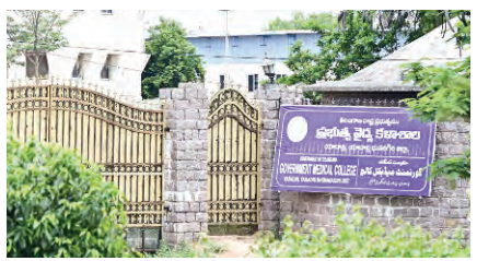
అనుమతి నిరాకరించిన జాతీయ వైద్య మండలి మౌలిక వసతులు లేకపోవడమే కారణం