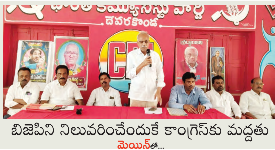
బిజెపిని నిలువరించేందుకే కాంగ్రెస్కు మద్దతు మొయిన్తో...