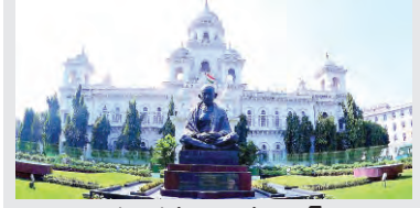
ప్రజాపక్షం / హైదరాబాద్

24న శాసనమండలి సమావేశం 25వ తేదీన బడ్జెట్ !