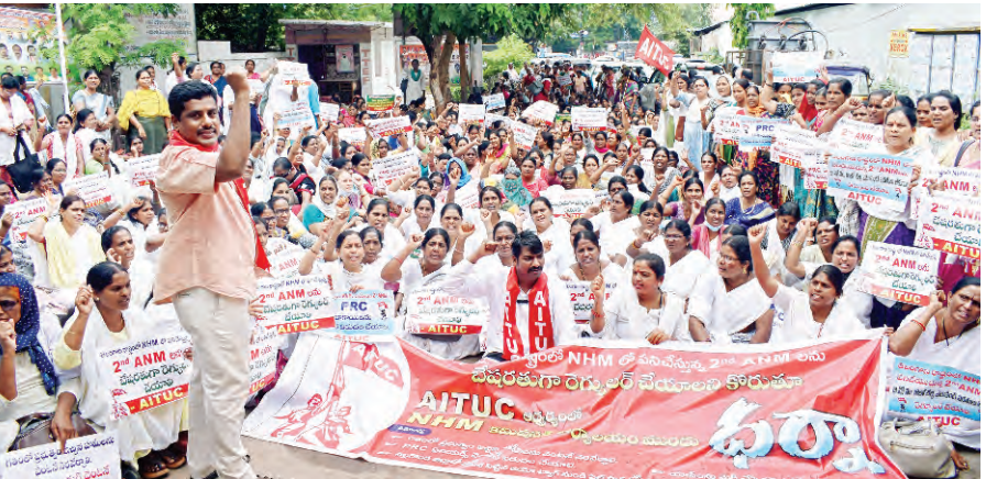
యూసిఎన్ఎసిలో పనిచేసే ఎఎన్ఎల అధిక పని ఒత్తిడికి గురవుతున్నారన్నారు. పిఎన్ఎలలో, యుపిఎన్ఎలలో ఓకే ఎఎన్ఎల పనిచేస్తున్న నబో సెంటర్లకు అదనంగా రూ.10 వేల చేతనాన్ని చెల్లించాలని ఆయన ఈ సందర్భంగా ప్రభుత్వాన్ని డిమాండ్ చేశారు. రూ.10 లక్షల హెల్త్ ఇన్సూరెన్స్, రూ.10 లక్షల లైఫ్ ఇన్సూరెన్స్

ర్శించి తెలంగాణ రాష్ట్రంలో కాంగ్రెస్ ప్రభుత్వం వస్తే మిమ్మల్ని కచ్చితంగా రెగ్యులర్ చేస్తామని హామీ ఇచ్చారని గుర్తు చేశారు. ప్రభుత్వం ఏర్పడడం తర్వాత ఎఎన్ఎలను, ఎంపీలను, మంత్రులను కలిపి పని విభజిస్తూ ప్రజా భవన్ కు వెళ్లి సిఎంఓలో కూడా పనితీరు ఇవ్వాలని ప్రస్తుతం ప్రభుత్వం వైపు నుండి ఎటువంటి స్పందన రాకపోవడంతో ప్రస్తుతం ధర్నాకు చేపట్టాల్సి వచ్చిందన్నారు. రెండవ ఎఎన్ఎలను సమస్యలు పరిష్కరించే అంతవరకు ఏబటియుసి విజ్ఞాపనలు పంపిస్తారు. రెండవ ఎఎన్ఎలను సమస్యలు పరిష్కరించే అంతవరకు ఏబటియుసి విజ్ఞాపనలు పంపిస్తారు. రెండవ ఎఎన్ఎలను సమస్యలు పరిష్కరించే అంతవరకు ఏబటియుసి విజ్ఞాపనలు పంపిస్తారు.