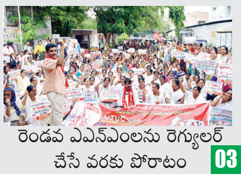
రెండవ ఎన్ఎంలను రెగ్యులర్ చేసే వరకు పోరాటం 03