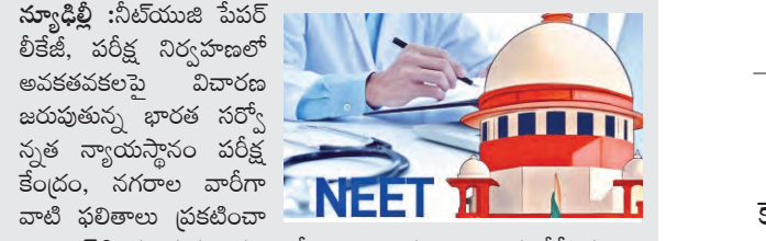
ప్రజాపక్షం / హైదరాబాద్

ఎన్టీపికు సుప్రీంకోర్టు ఆడిశం 20వ తేదీ మధ్యాహ్నం 12 గంటలలోపు వెబ్సైట్లో ఉంచాలని సూచన విచారణ 22కు వాయిదా