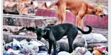
ప్రజాపక్షం / హైదరాబాద్

వీధి కుక్కల సైర విహారంపై హైకోర్టు ఆగ్రహం