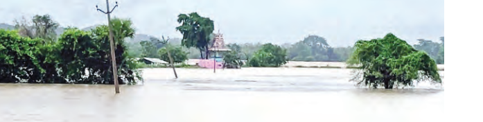
ప్రజాపక్షం / భద్రాచలం

అల్పవీడన ద్రోహ ప్రభావంతో భద్రాద్రి జిల్లాలో కుండపోత వాన కురుస్తోంది. గడిచిన 24 గంటల్లో జిల్లాలో 556 మి.మీ వర్షపాతం నమోదైంది. అత్యధికంగా చంద్రగిరి మండలంలో 60 మి.మీ, అత్యల్పంగా చంద్ర మండలంలో 3 మి.మీ వర్ష పాతం నమోదైంది. ఆకాశానికి చిల్లు పడినట్లుగా ఎక్కడాటిగా వాన పడుతుండటంతో జనజీవనానికి అంతరాయం ఏర్పడింది. జిల్లాలోని వాగులు వంకలు పొంగి పొచ్చుతున్నాయి. కాళిపేరు, కిన్నెరసాని, పెద్దవారు ప్రాజెక్టులలో పాటు పలుకుబోదం, మూక మామిడి ప్రాజెక్టులు నీటితో నిండటంతో జలకల సంతోషం చూశారు. ఎడతెలిసి లేకుండా కూర్చున్నవర్షం వర్షాలలో ప్రాజెక్టులో జలకల ఉద్భవించింది. చంద్రగిరి గల కాళిపేరు ప్రాజెక్టు భారీగా వరద నీరు వచ్చి చేరింది. దీంతో ప్రాజెక్టు గేట్లు ఎత్తి 87303