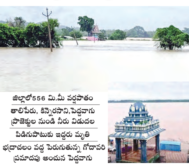
జిల్లాలో 566 మి.మీ వర్షపాతం తాలిపేరు, కిన్నెరసాని, పెద్దవారు ప్రాజెక్టుల నుండి నీరు విడుదల పిడిగుసాటుకు ఇద్దరు మృతి భద్రాచలం వద్ద పెరుగుతున్న గోదావరి ప్రమాదపు అంచన పెద్దవారు

ప్రజాపక్షం / భద్రాచలం అల్పవీడన ద్రోహి ప్రభావంతో భద్రాద్రి జిల్లాలో కుండపోత వాన కురుస్తోంది. గడిచిన 24 గంటల్లో జిల్లాలో 566 మి.మీ వర్షపాతం నమోదైంది. అత్యధికంగా చంద్రగిరి మండలంలో 60 మి.మీ, అత్యల్పంగా చంద్ర మండలంలో 3 మి.మీ వర్ష పాతం నమోదైంది. అకాశానికి చిల్లు పడినట్లుగా ఎక్కడాటిగా వాన పడుతుండటంతో జనజీవనానికి అంతరాయం ఏర్పడింది. జిల్లాలోని వాగులు వంకలు పొంగి పొచ్చుతున్నాయి. తాలిపేరు, కిన్నెరసాని, పెద్దవారు ప్రాజెక్టులలో పాటు పలుకుబొంద, మూక మామిడి ప్రాజెక్టులు నీటిలో నిండటంతో జలకల సంతోషం చూశారు. ఎడతెలిసి లేకుండా కూరుస్తున్న వర్షాలలో ప్రాజెక్టులో జలకల ఉద్భవించింది. చంద్రగిరి గల తాలిపేరు ప్రాజెక్టు భారీగా వరద నీరు వచ్చి చేరింది. దీంతో ప్రాజెక్టు గేట్లు ఎత్తి 87303 క్యూసెక్కుల నీటిని దిగువ ఉన్న గోదావరి నది లోనికి విడుదల చేశారు. అదే విధంగా కిన్నెరసాని ప్రాజెక్టు గేట్లు ఎత్తిన అధికారులు 1000 క్యూసెక్కుల నీటిని దిగువకు వదిలారు. నీటి విడుదల అగిపోయేంత వరకు సుమారు 40 గ్రామాలకు రాకపోకలు నిలిచిపోయాయి. అక్కరా వేలం సమీపంలోని పెద్దవారు ప్రాజెక్టు గేట్లు లేవే 30 వేల క్యూసెక్కుల నీటిని దిగువకు విడుదల చేశారు. పెద్దవారు ప్రాజెక్టు దిగువ ప్రాంతాలు తరువాతి 8 రోజు