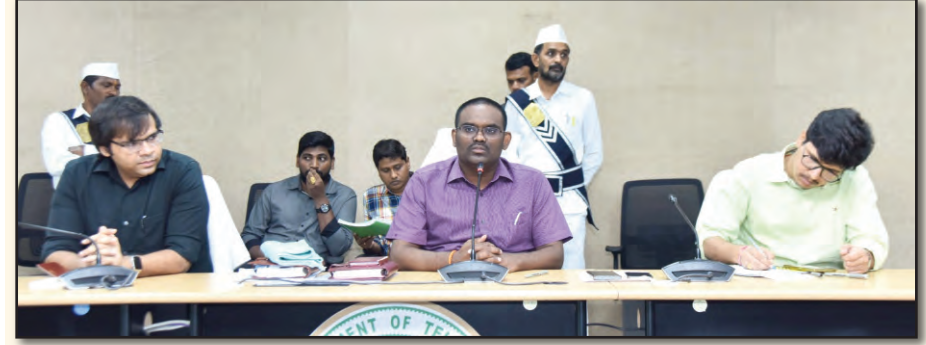
విద్య, వైద్య రంగాల పనితీరును నిశితంగా పర్యవేక్షించాలి : కలెక్టర్