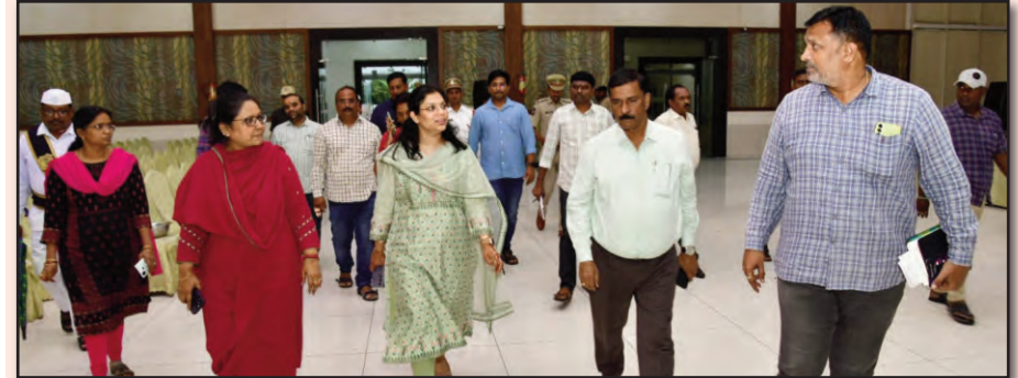
కలెక్టర్ పమేలా సత్పతి

ప్రజాపక్షం/కలీంగర్ ప్రతినిధి: రైతు భరోసా స్కీంపై ప్రజాభిప్రాయ సేకరణకు రైతు భరోసా అమలుపై ఏర్పాటు చేసిన సబ్ కమిటీ బృందం శుక్రవారం పర్యటిం చున్న సందర్భంలో అధికారులు పకడ్బందీ ఏర్పాట్లు చేపట్టాలని జిల్లా కలెక్టర్ పమేలా సత్పతి అధికారులను ఆదేశించారు. ఈ సందర్భంలో సమావేశం జరగనున్న బొమ్మి కల్ బైపాస్ లోని వి కన్వేన్షన్ హాలులో చేపట్టిన ఏర్పాట్లను గురువారం సాయంత్రం జిల్లా కలెక్టర్ పమేలా సత్పతి పరిశీలించారు. వేదిక వద్ద చేపట్టాల్సిన ఏర్పాట్లపై అధికారులకు తగిన సూచనలు చేశారు. సమావేశానికి హాజరు కానున్న రైతులు, రైతు ప్రతినిధులు, ప్రజా ప్రతినిధులకు తగిన సీటింగ్ అరేంజ్మెంట్స్ చేపట్టాలని ఆదేశించారు.