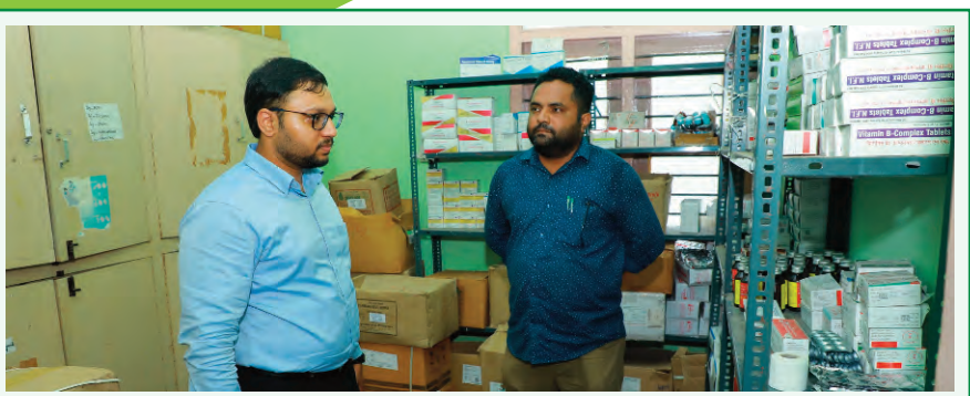
పిహెచ్‌సిలలో మెరుగైన వైద్యం అందించాలి