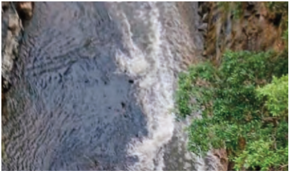
5598 క్యూసెక్కుల నీటిని ఆంధ్రాకు విడుదలవుతూ ఉండగా, శుక్రవారం ఎడమ కాలువ ద్వారా తెలంగాణకు నీటిని విడుదల చేశారు.

ప్రజాపక్షం/నందికొండ : చీఫ్ ఇంజనీర్ ఆదేశాను సారం నాగార్జునసాగర్ ప్రాజెక్టు అధికారులు శుక్ర వారం ఉదయం 8 గంటలకు నాగార్జునసాగర్ ఎడమ కాలువకు నీటిని విడుదల చేశారు. మొదటి దఫాగా 500 టీఎంసీల నీటిని విడుదల చేయగా ఆ తర్వాత దానిని 1000 క్యూసెక్కుల నుంచి క్రమంగా సాయం తాం వరకు 2000 క్యూసెక్కుల నీటిని పెంచుకుంటూ పోవడం జరుగుతుందని, ఈ నీటిని కేవలం తాగునీటి అవసరాల నిమిత్తం 1.5 టీఎంసీల నీటిని మూడు రోజులపాటు విడుదల చేయటం జరుగుతుందని ప్రాజెక్ట్ అధికారులు తెలిపారు. ప్రస్తుతం కుడి కాలువ ద్వారా