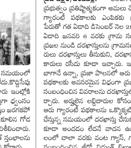
ప్రజా పాలన దరఖాస్తులకు మోక్షం లభించేనా... ప్రజాపక్షం/వింపిపల్లి: తెలంగాణ రాష్ట్ర ప్రభుత్వం ప్రతిపక్షానికి ఆమలు చేస్తున్న ఆరు గ్యాంగుల్లో పథకాలకు ఎంపికకు ప్రజాపాలన పేరుతో గత ఏడాది డిసెంబర్ నెల 28 నుండి ఈ ఏడాది జనవరి 6 వరకు గ్రామ సభల ద్వారా ప్రజల నుండి దరఖాస్తులను గ్రామసభలో అధికారులు దరఖాస్తులు తీసుకుని, దరఖాస్తులకు అధికారులు రసీదు కూడా ఇచ్చారు. ఇక్కడ వరకు బాగానే ఉన్నా, ప్రజా పాలనలో ఆరు గ్యాంగుల్లో పథకాలకు అవసరమైన విధంగా ప్రజలు వారికి సంబంధించిన వివరాలు దరఖాస్తులో పొందుపర్చారు. అందులోని లబ్ధిదారులకు మోక్షం ప్రభుత్వం ఆరు గ్యాంగుల్లో పథకాలను ఒక్కొక్కటిగా ఆమలు చేస్తున్న సమయంలో దరఖాస్తు చేసుకున్న వారికి కూడా అందడం లేదనే వాదన ఉంది. మండలంలో చాలా వరకు వంట గ్యాస్, గృహాభ్యంతరి సంబంధించిన జీరో విద్యుత్ బిల్లులు రావడం