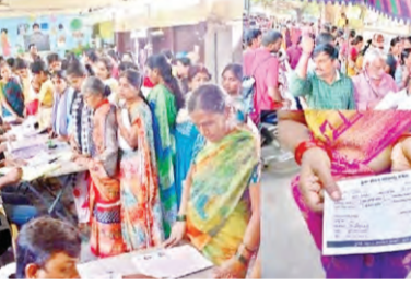
అనుమానం వ్యక్తం చేస్తున్నారు. ఏది ఏమైనా ఉన్నత అధికారులు స్పందించి ప్రజా పాలన దరఖాస్తులో నిర్లక్ష్యం వహించిన వారిపై చర్యలు తీసుకుని అప్పుడైన అభిదారులకు ఆరు గ్యాంగుల టీలు అందించాలా చర్యలు చేపట్టాలని, దరఖాస్తు చేసుకున్న దాటా అందుబాటులో లేని వారికి మళ్ళీ అవకాశం కల్పించాలని, ఇది వరకే చేసుకున్న వారికి సవరణకు అవకాశం కల్పించి, పథకాలను అప్పుడైన వారందరికీ అందించి ప్రభుత్వ లక్ష్యాన్ని పూర్తి చేయాలని ప్రజలు కోరుతున్నారు.

లేదని వంట గ్యాస్ సంబంధించిన, ఆపి సమాధుల్లో కూడా తప్పులు నమోదు కావడం చేత కొంతమంది అప్పుడు 500 గ్యాస్ కోల్పోతున్నామని మండల కార్యాలయానికి వెళ్లి విచారణ చేయాలి త్వరలోనే సవరణకు గురిచేసే ప్రభుత్వం చెప్పడం కొనసాగుతున్నా, ప్రజాపాలనలో దరఖాస్తు సమర్పించిన కొంతమంది ప్రజా పాలన కనిపించడం లేదని వాపోతున్నా. ప్రజా పాలనకు సంబంధించి అంతర్జాలంలో వివరాలు కనిపించకపోవడంతో రోజులు చూపిస్తూ, సంబంధించిన వివరాలు దరఖాస్తులో పొందుపర్చారు. అయితే చాలా ఎంపిటి చెప్పేవారు వల్ల కొంతమంది అప్పుడు, మహిళాత్మిలో భాగం అయిన వంట గ్యాస్, గృహాభ్యంతరి, పథకాలు కొరకు దరఖాస్తు చేసుకున్నా దరఖాస్తు పాఠాలు ఎంపిటి చేసేప్పట్టే కంప్యూటర్ ఆపరేటర్ల నిర్లక్ష్యం కారణంగా పథకాలు కోల్పోయామని