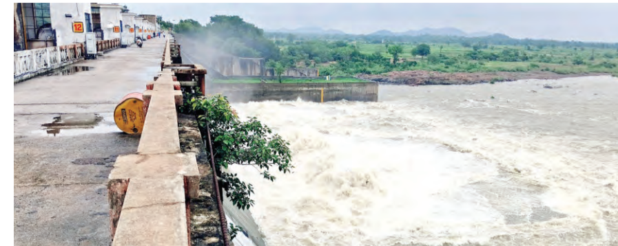
కర్నూలు వరద నీరు వచ్చి చేరడంతో ప్రాజెక్టు మూడు గేట్లు ఎత్తి దిగువకు 14359 క్యూసెక్కుల నీటిని గౌడవరంతో కలిపి వదులుతున్నట్లు అధికారులు తెలియజేశారు. ప్రస్తుతం ప్రాజెక్టు నీటి మట్టం 690.875/700 వద్ద ఉన్నట్లు అధికారులు తెలియజేశారు.