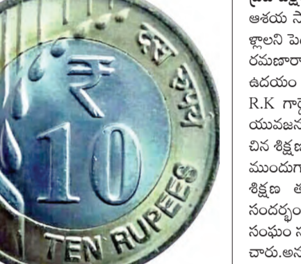
నేరంగా పరిగణించవచ్చు. తప్పుడు పదంతులు సన్నుతుకుండా ఇవ్వడం, తీసుకోవడం జరిగాలని రిజర్వు బ్యాంకు ఆఫ్ ఇండియా కోరుతోంది. కొంతమంది తీసుకోకపోవడం వలన ఆర్థిక సమస్యలు నెలకొంటున్నాయి. వేల కోట్లు నర ఫరు నిలకడగా ఉండటంతో ఆర్థికంగా చిల్లర సమస్య మూలకారణమవుతుంది. పది రూపాయల నాణెం స్వీకరించకపోతే 2011 క్షేత్ర 6(1) క్రింద నేరంగా పరిగణించవచ్చని న్యాయ నిపుణులు చెబుతున్నారు.

* పదనాణెల వ్యాపారులకు ఇబ్బందులు ప్రజాపక్షం/ఎల్లారెడ్డిపేట: రిజర్వు బ్యాంకు ముద్రించిన పది రూపాయల నాణెలు తీసుకోకపోతే ఫిర్మాలు చెయ్యవచ్చని ఆర్ బి బి ఇంటి ఇల్లారా వినయాగదారులు తెలిపేయడం లేదు. సన్నుతీసుకోండి నేను చెలామణిలో ఉన్నానని పది రూపాయల సిక్సా చెబుతోంది. చలామణిలో ఉంటే చిల్లర సమస్య తగ్గుతుంది. ప్రజలు గందరగోళానికి గురవ్వద్దని వ్యాపారులు చెబుతున్నారు. నాణెలు చలామణిలో ఉండటం వలన సమస్య తగ్గుతుందిని నిపుణులు అంటున్నారు. నాణెలు లోలో నాణెలు ఇచ్చి నగదుగా బహుమతిగా వచ్చని అంటున్నారు. నాణెలు తీసుకోకపోతే పని వలనే చిల్లర సమస్యలు తలెత్తుతున్నాయని వ్యాపారులు అంటున్నారు. ఈ సమస్య పై తలపెట్టడాని మారదని పేర్కొన్నారు. పదిరూపాయల సిక్సా తీసుకోకపోతే నేరంగా పరిగణించవచ్చని కేంద్ర మాట్లాడుతూ వేసినా కొంతమంది పట్టుకుంటున్నారని, పది రూపాయల నాణెం స్వీకరించకపోతే 2011 క్షేత్ర 6(1) క్రింద నేరంగా పరిగణించవచ్చని న్యాయ నిపుణులు చెబుతున్నారు.