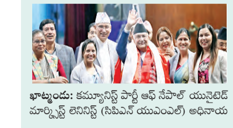
భాటుండు: కమ్యూనిస్టు పార్టీ ఆఫ్ నేపాల్ యునైటెడ్ మార్క్సిస్ట్ లెనినిస్టు (సిపిఎం యుఎంఎల్) అధినాయకులు