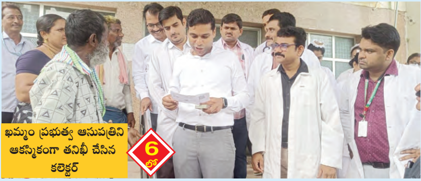
ఖమ్మం ప్రభుత్వ ఆసుపత్రిని అకస్మికంగా తనిఖీ చేసిన కలెక్టర్