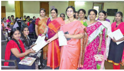
హాజరైనారు. నేర్చుకున్న కోర్సులలో వారి యొక్క నైపుణ్యం పరీక్షల ద్వారా తెలుస్తుందని, తమ కాళ్ళ