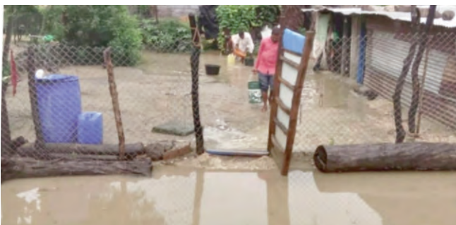
సరిపోతున్నాయి తప్ప కార్యరూపం దాల్చలేదు. ఇప్పటికైనా ప్రజాప్రతినిధులు, అధికారులు ముధోల్ అభివృద్ధి పై దృష్టి పెట్టి స్థానికుల సమస్యలను పరిష్కరించి కనీస వసతులు కల్పించాలని ప్రజలు కోరుతున్నారు.

ప్రజాపక్షం/ముధోల్ : ముధోల్ పేరుకే నియోజకవర్గ కేంద్రం నియోజకవర్గ లో ఉండాలని ఎలాంటి వసతులు లేవు. ఎక్కడ చూసిన సమస్యలే. పై ఫోటోలో ఏదైతే కనబడుతోందో అది వాగు కాదు, నది కాదు ముధోల్ లోని బస్టాండ్ నుండి ఊళ్లకి వెళ్లే ప్రధాన రోడ్డు, డ్రైనేజీ లు లేక వర్షపు నీరు మొత్తం రోడ్డుపై ప్రవహిస్తూ వాహనదారులకు తీవ్ర ఇబ్బందిగా మారింది. ఎన్నో ఏళ్లుగా ఈ రోడ్డు ఇలానే ఉంది, వర్షాకాలం వస్తే సరి అంతే సంగతి. నాలాల ద్వారా పోయే నీరు మార్గం లేక రోడ్డు పై ప్రవహిస్తోంది. ప్రతి గ్రామంలో మార్పు జరిగిందేమో కానీ ముధోల్ లో మార్పు కనుచూపు మేరలో కూడా కనబడదు. గత ఎన్నో ఏళ్లుగా అదే ఊరు అవే సమస్యలు, అధికారులు మారిన ప్రజాప్రతినిధులు మారిన ముధోల్ మాత్రం ఇంతే. ఆసుపత్రి నుండి రోడ్డు, డ్రైనేజీ లు ఇలా ప్రతి రంగంలో సమస్యలు, సమస్యల నిలయం ముధోల్ అన్న సరితూగే విషయమే గ్రామంలో విశాలవంతమైన రోడ్డు లేవు, ముఖ్యంగా ప్రధాన రోడ్డు ఎక్కడ చూసిన గుంతలతోనే. ప్రతి ఎన్నికల ముందు ముధోల్ ను అన్ని రంగాలను అభివృద్ధి చేస్తామన్న నాయకుల మాటలు వాగ్దానాలకే