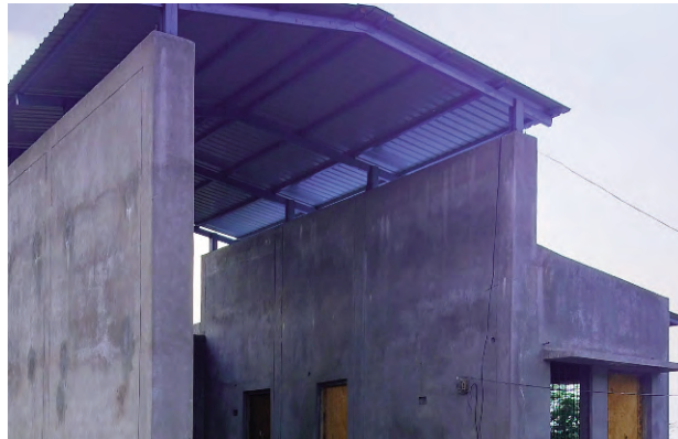
కేటాయించి ఫైర్ స్టేషన్ నిర్మాణానికి శంకుస్థాపన చేశారు. తదుపరి పనులు చేపట్టిన కాంట్రాక్టర్ రూ.28 లక్షల నిధులతో నాసిరకం పనులతో కేవలం షెడ్యూ

ప్రజాపక్షం/చొప్పదండి:చొప్పదండి లోని అగ్నిమాపక కేంద్రం (ఫైర్ స్టేషన్) నిర్మాణానికి మోక్షం కలగడం లేదు. 2017లో గత బిఆర్ఎస్ ప్రభుత్వం నియోజకవర్గానికొక ఫైర్ స్టేషన్ ఉండాలని నిర్ణయించింది. ఈ మేరకు అదే సంవత్సరం చొప్పదండికి రూ.28 లక్షల నిధులతో ఫైర్ స్టేషన్ నిర్మాణానికి మంజూరు చేసింది. అయితే అందుకు అనువైన స్థలం దొరకకపోవడంతో ఆ నిధులు వెనక్కి వెళ్లినట్లు సమాచారం. ఆ తర్వాత 2022లో రూ.28 లక్షల నిధులతో చొప్పదండి పట్టణంలోని నవోదయ పాఠశాల ఎదురుగా ఉన్న స్థలాన్ని