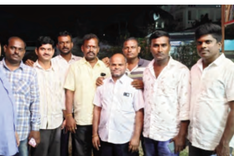
చేయడం జరిగింది. తలకు తీవ్రమైన గాయాలతో, అపరోష కోసం 10 లక్షల రూపాయల అవసరం ఏర్పడింది. పేద కుటుంబం సహాయం కోసం ఎదురుచూస్తోంది. దాతలు తమ సహాయాన్ని జీపై, ఫోన్ పై నెంబర్ 8885013554 కు పంపవలసిందిగా కోరారు.