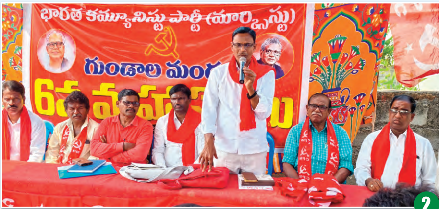
అభివృద్ధికి నిధులు కేటాయించాలి