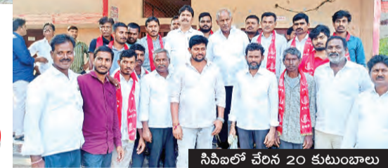
సీఎల్డీలో చేరిన 20 కుటుంబాలు

రైతులకు గోనె సంచులు అందుబాటులో ఉంచాలి కేంద్రాలకు వచ్చిన ధాన్యాన్ని తక్షణమే కొనుగోలు చేయాలి కొత్తగూడెం శాసన సభ్యులు కునంనేని సాంబశివరావు