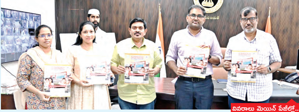
వివరాలు మెయిన్ పేజీల్లో...