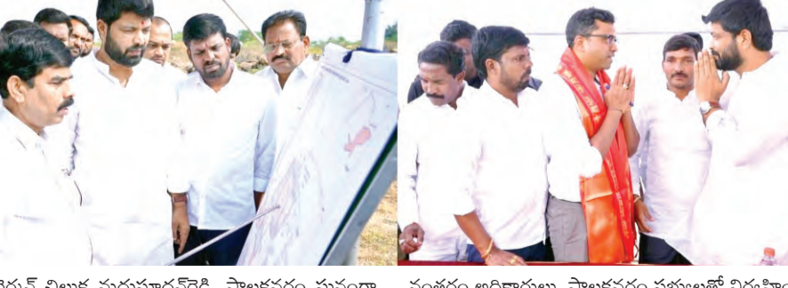
నూతన మార్కెట్ నిర్మాణం కోసం ప్రజాపక్షం/రంగారెడ్డి ప్రతినిధి (మధ్య) ప్రమాణాలతో నూతన మార్కెట్ నిర్మాణం చేపడతామన్నారు.

ప్రజాపక్షం/రంగారెడ్డి ప్రతినిధి : కొవాడ ప్రాంతంలో రైతులకు ఉపయోగపడే విధంగా అంతర్జాతీయ ప్రమాణాలతో నూతన మార్కెట్ ను నిర్మిస్తామని రాష్ట్ర వ్యవసాయ మార్కెటింగ్ శాఖ సంచాలకులు ఉదయ్ కుమార్ వెల్లడించారు.