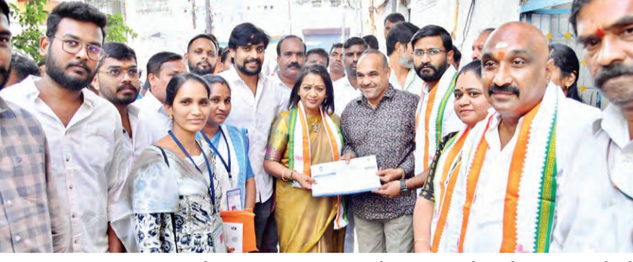
సర్వే పనులు చేపట్టిన అర్జులలో మేయర్ గద్వాల విజయలక్ష్మి (మధ్య) సమగ్ర ఇంటింటి కుటుంబ సర్వే ప్రధాన ఉద్దేశమని ప్రకటించారు.

మేయర్ గద్వాల విజయలక్ష్మి ప్రజాపక్షం/హైదరాబాద్ : అర్జులలో ప్రభుత్వ సంక్షేమ పథకాల లబ్ధి చేకూర్చడమే సమగ్ర ఇంటింటి కుటుంబ సర్వే ప్రధాన ఉద్దేశమని, ప్రజల జీవన ప్రమాణాలు మెరుగు పరిచేందుకు ఈ సర్వే దోహదపడుతుంది మేయర్ గద్వాల విజయలక్ష్మి అన్నారు.