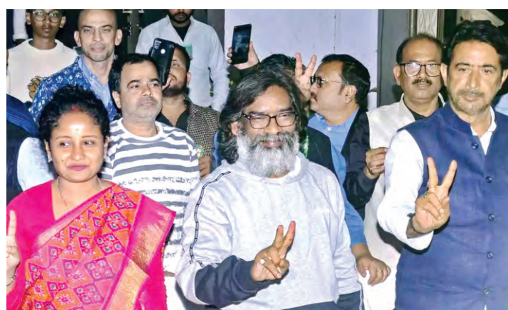
మహారాష్ట్ర ఫలితాలు అనూహ్యం : రాహుల్ ఖర్కే