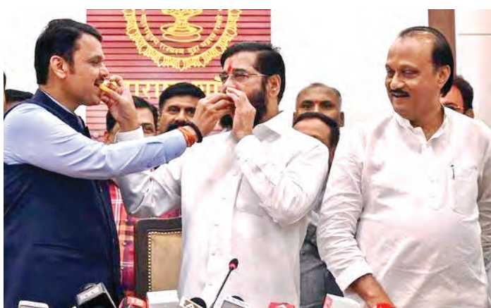
అభివృద్ధి, సుపరిపాలన గెలిచింది : ప్రధాని