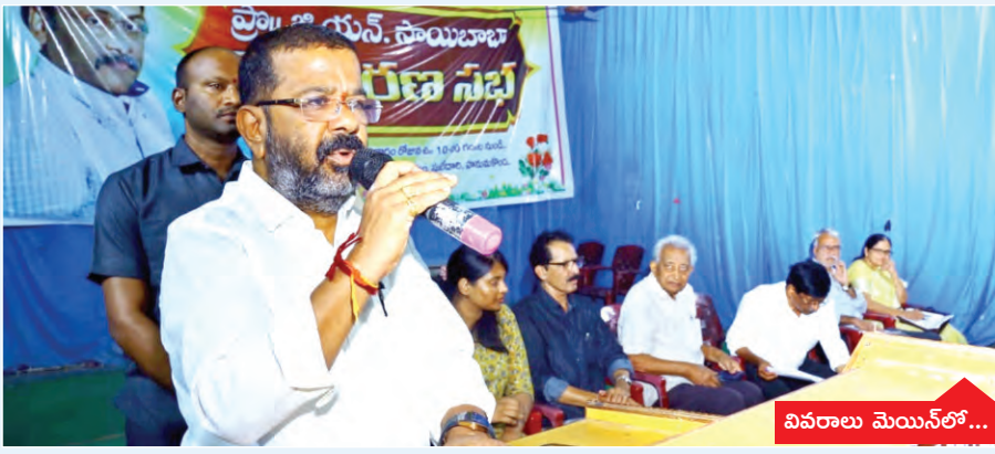
వివరాలు మెయిన్ లో...