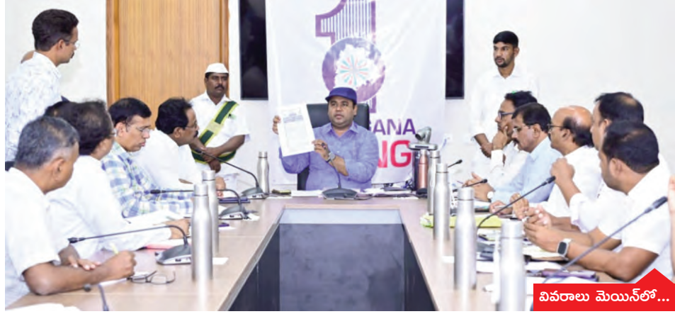
వివరాలు మెయిన్ లో...