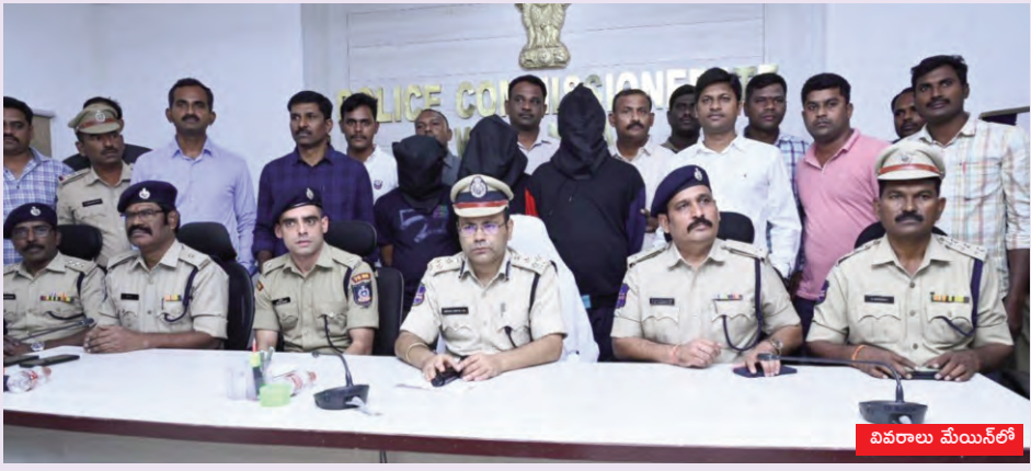
వివరాలు మేయిన్ లో