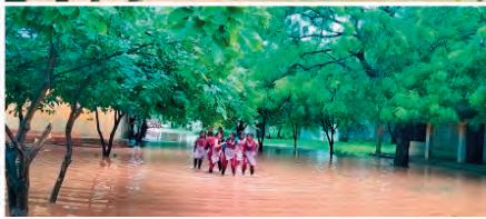
ఆద్యక్షంలో వద్యార్థులతో కలిసి ఆందోళన కార్యక్రమం చేపడుతామని హెచ్చరించారు.