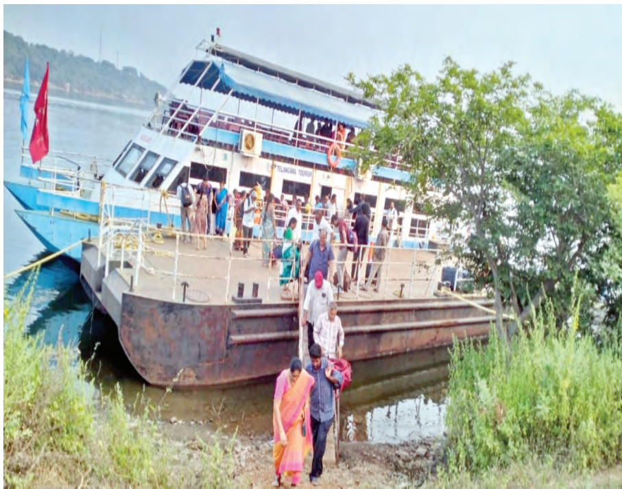
లేదు తెలంగాణ పర్యాటక శాఖ అందుబాటులోకి తెచ్చిన పర్యాటకులను ఎంతగానో ఆకట్టుకుంటుంది. అయితే ఆదివారం సెలవు రోజు కావడంతో సాగర్ వద్ద పర్యాటకుల సంఘం నెలకొంది పర్యాటకులు లాంచీలో నాగార్జున

ప్రజాపక్షం/నందికొండ: నాగార్జునసాగర్ నుండి శ్రీశైలం కు లాంచీ యాత్రను తెలంగాణ టూరిజం దాదాపు రెండేళ్ల తర్వాత గత నెల 2 న మొదటి యాత్రను ప్రారంభించగా ఆదివారం 7 వ యాత్రను దిగ్విజయంగా పూర్తిచేసుకుంది. మొదటి యాత్రకు ఆశించిన స్పందిలో యాత్రికులు లేక యాత్రను కొనసాగించగా ఆ తర్వాతి యాత్రలకు భారీగా పబ్లిసిటీ రావడంతో రెండు, మూడు రోజుల్లోనే టిక్కెట్లు బుక్ అయిపోతున్నాయని తెలంగాణ టూరిజం శాఖ తెలియజేసింది.రెండేళ్ల తర్వాత రిజర్వాయర్ నిండుకుండా మారి రిజర్వాయర్ నీటిమట్టం 590 అడుగులకు చేరుకోవడంతో తెలంగాణ టూరిజం శ్రీశైలం యాత్రకు శ్రీకారం చుట్టారు. ఈ యాత్ర దట్టమైన నల్లమల అడవుల సదుమ కృష్ణవేణి తరంగాలపై లాంచీలో ప్రయాణం ఒక మధురమైన మధురానుభూతిని కలిగిస్తుందని ప్రయాణికులు తమ అనుభూతిని తెలియజేస్తున్నారు.సాగర్ నుంచి శ్రీశైలం వరకు కృష్ణా నదిలో 120 కిలోమీటర్ల దూరం 6 గంటల పాటు సాగే సుధీర్ఘ లాంచీ ప్రయాణం ఆనందాన్ని అహోదాన్ని పంచినోంది అనడంలో ఎటువంటి సందేహం లేదు తెలంగాణ పర్యాటక శాఖ అందుబాటులోకి తెచ్చిన ఈ యాత్రప్రయాణికులు తమ అనుభూతిని తెలియజేస్తున్నారు.సాగర్ నుంచి శ్రీశైలం వరకు కృష్ణా నదిలో 120 కిలోమీటర్ల దూరం 6 గంటల పాటు సాగే సుధీర్ఘ లాంచీ ప్రయాణం ఆనందాన్ని అహోదాన్ని పంచినోంది అనడంలో ఎటువంటి సందేహం