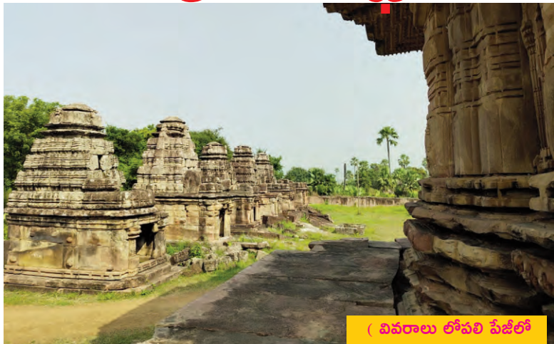
( వివరాలు లోపలి పేజీలో )