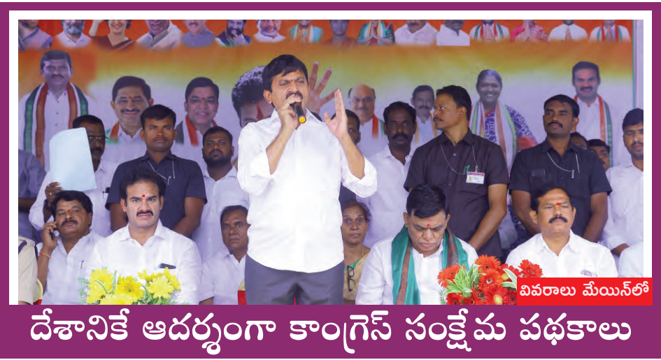
దేశానికే ఆదర్శంగా కాంగ్రెస్ సంక్షేమ పథకాలు