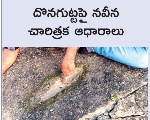
దొనగుట్టపై నవీన చారిత్రక ఆధారాలు

ప్రజాపక్షం/గణపరం : 800 ఏళ్లకు పైగా చరిత్ర కలిగిన కాకతీయుల కళా వైభవానికి ఎట్టకేలకు మోక్షం లభించింది. కాకతీయుల వారసత్వ సంపదైన కోటగుళ్ళకు కొత్త రూపు సంతరించుకొంది. కాకతీయులు నిర్మించిన రామప్ప ఖ్యాతి ఖండాంతరాలు దాటి ప్రపంచ వారసత్వ సంపదగా గుర్తించగా ఇప్పుడు రామప్ప సరసన కోటగుళ్ళకు ప్రత్యేక స్థానం దక్కింది. రామప్ప దేవాలయ అభివృద్ధి తో పాటు శిథిలమవుతున్న కోటగుళ్ళ అభివృద్ధి కి సాస్కి స్కీమ్ ద్వారా చరిత్రలో మొదటిసారి కేంద్ర ప్రభుత్వం నిధులు కేటాయించింది. యూనిస్కో గుర్తింపు పొందిన రామప్ప దేవాలయానికి కేవలం 9 కిలోమీటర్ల దూరంలో ఉన్న కాకతీయుల కళా క్షేత్రం గణపేశ్వరాలయం కోటగుళ్ళకు త్వరలో మహారాజు గణపేశ్వరాలయం కోటగుళ్ళతోపాటు గణప సముద్రం, సరస్సు, రామప్ప సమీపంలో ఉన్న ఇంచర్ల గ్రామాన్ని కూడా సాస్కి పథకం లో చేర్చి కేంద్ర ప్రభుత్వం పెద్ద ఎత్తున నిధులు కేటాయించింది. కాకతీయుల కట్టడాలకు రోజురోజుకు పర్యాటకుల సంఖ్య పెరుగుతోంది. ఆలయాలభివృద్ధికి కేంద్ర, రాష్ట్ర ప్రభుత్వాలు కృషి చేస్తున్నాయి. కేంద్ర పర్యాటక, సాంస్కృతిక శాఖ అధ్యక్షత వారసత్వ వృద్ధి పథకం (ప్రసాద్) 2022లో చేర్చింది.