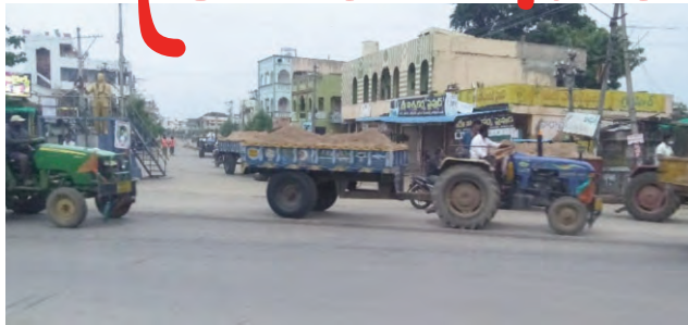
వచ్చిన కొత్తలో ఇసుకను కట్టడి చేసిన పోలీసులు కొద్దిరోజులు కాకమునుపే చూసే చూడనట్లు వైభిరి అనుమానాలు వ్యక్తం చేస్తున్న స్థానిక ప్రజలు

ప్రజాపక్షం/వర్తన్వపేట : వర్తన్వపేట మండల పరిధిలో ఇసుక రవాణా అనుమతులు లేకుండా కొనసాగించడం చట్టరిత్యా నేరమని కొద్ది రోజులపాటు వర్తన్వపేట పోలీసులు వాటిని అడ్డుకున్నారు. ఇంతలో ఏం జరిగిందో ఎవరికీ అర్థంకాని పరిస్థితి చోటుచేసుకుంది. సరిగ్గా 15 రోజులు పూర్తి కాకమునుపే మళ్ళీ యధావిధిగా కొనసాగుతున్నాయంటే పోలీసు అధికారులు చూసి చూడనట్లు వ్యవహరించడం వల్లే సాధ్యమవుతుందన్న విషయం ప్రచారం అవుతుంది. వర్తన్వపేట పోలీస్ స్టేషన్ కి రెగ్యులర్ బదిలీలలో భాగంగా వచ్చిన పోలీసు అధికారులు చట్ట వ్యతిరేక పనులు చేస్తే సహించేది లేదని దిక్కరించి, మొండి పట్టు పట్టారు. ఇంతలో ఏదో జరగరాని సంఘర్షణ జరగడం వల్లే వారు వెనుకడుగు వేశారన్న ఆరోపణలు వ్యక్తం అవుతున్నాయి. వచ్చిన కొత్తలో ఎందుకు అంత పట్టు బిగించే అవకాశం తీసుకోవాలి..? కొద్దిరోజులు గడవక ముందే ఎప్పటిలాగే మళ్ళీ ఎందుకు ప్రోత్సహించాలన్న సందేహం ప్రజల్లో ప్రశ్నార్థకమైంది. తవ్వకాలను నిర్వహణ, ఇసుక రవాణా కారణంగా జరుగుతున్న నష్టాలపై స్థానిక అధికారులకు ఏమైనా అవగాహన ఉందా..? తవ్వకాల నిర్వహణ చేయడం వల్ల భూభాగంలో నీటి శాతం తగ్గిపోతుంది, వ్యవసాయానికి ఉపయోగపడే సారవంతమైన