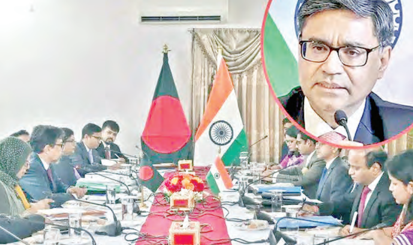
శాఖ ధిల్లీ నుంచి విడుదల చేసిన ఒక ప్రకటనలో బయరుతున్న దాడుల విషయాన్ని కూడా ప్రస్తావించారు. భారత్-బంగ్లాదేశ్ మైత్రీ సంబంధాలపై మిస్సీ చర్చించారు, అదే విధంగా బంగ్లాదేశ్ లో మైనారిటీలపై వ్యవహరిస్తున్న అధికార వ్యవస్థను సమీక్షించారు.

వర్గాలను కక్షలు కల్పించాలని కోరబట్టి తెలిపారు. జమీమ్ ఉద్దీన్ కూడా ఈ విషయంలో సానుకూలంగా స్పందించారని అన్నారు. ఈ విషయంపై విద్యా రంగానికి ఆందోళన ఉద్ధృతం కావడంతో, బంగ్లాదేశ్ లో విడివిడి పెట్టిన అప్పటి అధ్యక్షురాలు షేక్ హసీనా భారత్ చేరుకున్న విషయం తెలిసింది. ఆ తర్వాత భారత్ నుంచి భారత్ తరపున ఇదే తొలి అధికారిక పర్యటన. హసీనాపై బంగ్లాదేశ్ పలు కేసులు నమోదయ్యాయి. హసీనాను విచారించాలి ఉందని, కాబట్టి ఆమెను తమకు అప్పగించాలని బంగ్లాదేశ్ తాత్కాలిక ప్రభుత్వం డిమాండ్ చేస్తున్న నేపథ్యంలో ఈ పర్యటన ప్రాధాన్యతను సంతరించుకుంది. కాగా, బంగ్లాదేశ్ తాత్కాలిక ప్రభుత్వ ముఖ్య సలహాదారు మహ్మద్ యూనుస్ విదేశాంగ వ్యవహారాల సలహాదారు మహ్మద్ తోషాద్ సోసే నేను కూడా మిస్సీ కలిశారు. వారితో భేటీ అతాజనకమైన వాతావరణం జరిగిందని భారత విదేశాంగ మంత్రిత్వ