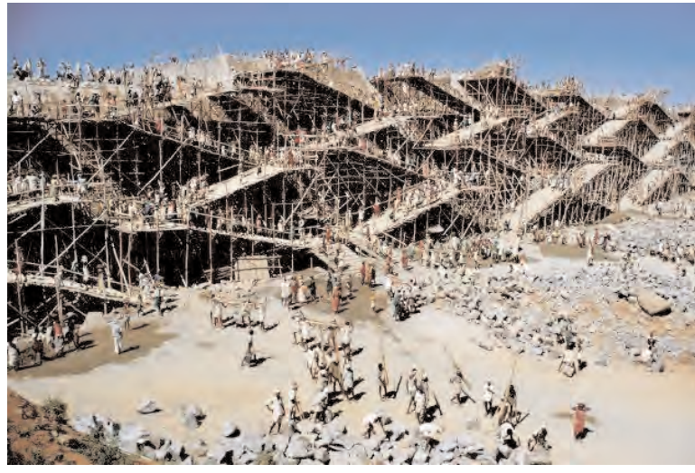
రాజీ కట్టడాల్లో మొదటి స్థానంలో నిలిచింది. ఈ జలాశయ విస్తీర్ణం 110 చదరపు మైళ్ల కాగా, గరిష్ట నీటిపట్టుం 690 అడుగులు. ప్రాజెక్టు కుడి కాలువను జవహర్ కాలువగా, ఎడమ కాలువను లాల్ బహదూర్ కాలువగా నామకరణం చేయడం జరిగింది. 70 ఏళ్లగా ఈ ప్రాజెక్టు రెండు తెలుగు రాష్ట్రాలకు ఆధునిక దేవాలయంగా నిలిచింది.

ప్రజాపక్షం/నందికొండ: రెండు తెలుగు రాష్ట్రాలకు జీవనాది లక్షల ఎకరాలకు సాగు నీరు దింపే భూపాత్ర, బహుకార్య సాగర్ ప్రాజెక్టు నాగార్జున సాగర్, కోట్లాది తెలుగు ప్రజలకు జీవనాధారంగా మారిన నాగార్జున సాగర్ ప్రాజెక్టు శంకుస్థాపనకు నేటితో 69 ఏళ్లు పూర్తి తీసుకొని 70వ వసంతంలోకి ఆడుగుపెట్టింది. తెలుగు రాష్ట్రాలను అన్నపూర్ణ తీర్చిదిద్దిన ఈ మహా కట్టడం మహాస్మృతిమైన మానవ ప్రయత్నానికి మరుపురాని నివాళిగా నిలుస్తోంది. కరువు కాటకాలతో అల్లారుతున్న రాష్ట్రానికి అటు సాగునీరు ఇటు త్రాగు నీటితో పాటు, విద్యుత్ ఉత్పత్తి అవసరాల కోసం ఇక్కడ ప్రాజెక్టు అవసరమని భావించిన నల్లగొండ జిల్లా నందికొండ వద్ద కృష్ణానదిపై ప్రాజెక్టు నిర్మాణానికి అప్పటి పాలకులు సదుం బిగించారు. ఇంతటి అపురూపమైన ఈ ప్రాజెక్టుకు సరిగ్గా 70 ఏళ్ల క్రితం అప్పటి ప్రధాని పండుజీ బహదూర్ లాల్ నెహ్రూ ద్వారా 1955 డిసెంబర్ 10వ తేదీన నాగార్జున సాగర్ వద్ద ప్రాజెక్టుకు బీజం పడింది. ఈ బహుకార్య సాగర్ ప్రాజెక్టు ప్రపంచంలోనే అత్యంత ఎత్తయిన పూర్తి మానవ నిర్మిత