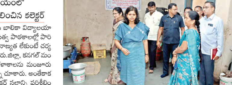
రాలను, పాఠశాల శుభ్రం చేసి ప్రదేశాన్ని పరిశీలించారు. కె.వెన్.పాఠశాల అవసరం పరిశుభ్రత లోపంపై ప్రిన్సిపాల్ పై కలెక్టర్ ఆగ్రహం వ్యక్తం చేశారు. కాగా కనగల్ కేజీపిల్ మొత్తం 230 మంది విద్యార్థులు ఉండగా, 3 తరగతి గదులలో బెంచీలు లేక విద్యార్థులు కింద కూర్చోవడం గమనించిన జిల్లా కలెక్టర్ అక్షయ్ బెంచీలు ఏర్పాటు కై బోర్డ్ ఆఫ్ ఇంటర్వీయర్లకు తీర్మానాలు నిర్వహించాలని అడేశించారు. అంతేకాక కేజీపిల్లో అదనపు తరగతి గదులు నిర్మాణానికి ప్రతిపాదనలు పంపించాలని చెప్పారు.

ప్రజాపక్షం/నల్లగొండ (కనగల్): కన్పూర్ గాంధీ బాలికా విద్యాలయాలకు, గురుకుల పాఠశాలలు, సంక్షేమ హాస్టళ్లు, ప్రభుత్వ పాఠశాలల్లో పారిశుధ్య లోపం, మద్యపాన భోజనంలో పరిశుభ్రత, నాణ్యత లేకుంటే చర్యలు తప్పవని జిల్లా కలెక్టర్ జలా త్రిపాఠి హెచ్చరించారు. జిల్లా, కనగల్ మండలానికి రాష్ట్ర ప్రభుత్వం ఇటీవల జూనియర్ కళాశాలను మంజూరు చేయగా నవంబర్ 5, 9, 11 తేదీల విజ్ఞాన పుస్తక స్థలాన్ని చూశారు. అంతేకాక 339 నల్ల సెంటర్ల వల్ల ప్రకృతి వనం వద్ద కలెక్టర్ స్థలాన్ని పరిశీలించారు. రాష్ట్ర ప్రభుత్వం గణవారం కనగల్, తిప్పర్ల మండలాలకు జూనియర్ కళాశాలను మంజూరు చేస్తూ ఉత్తర్వులు జారీ చేసిన విషయం తెలిసింది. అయితే కనగల్ మండలంలో జూనియర్ కళాశాల తో పాటు, ప్రతికే ఫౌండేషన్ సహకారంతో అండోర్ స్టేషన్ ను నిర్మాణానికి స్థలాన్ని చూడాలన్న రాష్ట్ర రోడ్డు, భవనాలు, సినిమా హాల్ గ్రామాలు మంత్రి కోసుటి రెడ్డి వెంటబెట్టే అడేశాల మేరకు జిల్లా కలెక్టర్ ఆర్.జి. అశోక్ రెడ్డి, తాసిల్దార్ వచ్చి లతో కనగల్ స్థలాలను పరిశీలించారు. ఈ సందర్భంగా వక్రనే ఉన్న కన్పూర్ గాంధీ బాలికా విద్యాలయానికి వెళ్లి వంటగదిని, పాఠశాల పరిసరాలను, పాఠశాల శుభ్రం చేసి ప్రదేశాన్ని పరిశీలించారు. కె.వెన్.పాఠశాల అవసరం పరిశుభ్రత లోపంపై ప్రిన్సిపాల్ పై కలెక్టర్ ఆగ్రహం వ్యక్తం చేశారు. కాగా కనగల్ కేజీపిల్ మొత్తం 230 మంది విద్యార్థులు ఉండగా, 3 తరగతి గదులలో బెంచీలు లేక విద్యార్థులు కింద కూర్చోవడం గమనించిన జిల్లా కలెక్టర్ అక్షయ్ బెంచీలు ఏర్పాటు కై బోర్డ్ ఆఫ్ ఇంటర్వీయర్లకు తీర్మానాలు నిర్వహించాలని అడేశించారు. అంతేకాక కేజీపిల్లో అదనపు తరగతి గదులు నిర్మాణానికి ప్రతిపాదనలు పంపించాలని చెప్పారు.