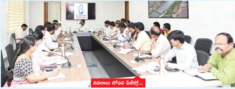
వివరాలు లోపలి పేజీల్లో...