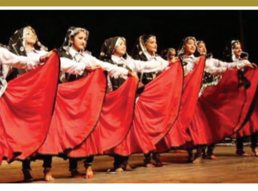
వలయంలో ఉన్న అమ్మాయిలు డోలు వాద్యాన్ని అనుగుణంగా చప్పుట్లు కొడతారు. చివరి దశలో, పుస్తకం ప్రధానంగా వలయం చుట్టూ తిరుగుతూ ప్రదర్శించబడుతుంది. ఈ పుస్తకం కొన్ని సార్లు సాధారణంగా వరుడు తన కొత్త వధువును ఇంటికి తీసుకురావడానికి చాలా కాలం వేచి ఉన్న సమయంలోనూ ప్రదర్శిస్తారు. అలాంటి సమయంలో, మహిళలు తమ ప్రదర్శనలో మొత్తం వివాహ వేడుకను అనుకరిస్తారు. కొత్తగా పెళ్లయిన జంటలో పాటు వివాహ కుటుంబం సురక్షితంగా తిరిగి రావాలని మహిళలు కోరుకుంటారు.

గ్రామీణ జీవితంలోని అందాన్ని, సుఖాన్ని, అక్కడి కల్చరు తేలి మనసులను పరిచయం చేసే పుస్తకంగా భోలియాను పేరొచ్చింది. ఈ పుస్తకం రీతిలో క్రీస్తు పురుషులు ఇద్దరు పాల్గొన్నారు. పుస్తకంలో క్లిష్టమైన పాదకథలు, పాద విన్యాసాలను మనోరంజకంగా ప్రదర్శిస్తారు. ఈ పుస్తకాన్ని ఎక్కువగా పంపిణీ చేయడానికి యంతోషం సంతోషాన్ని అందించాల్సి ఉంది. పుస్తక రూపంలో వెల్లడిస్తారు. ఇది వ్యవసాయంలో వారి విజయాన్ని, సంతోషాన్ని ప్రతిబింబిస్తుంది. పాఠ్యాంశాల్లో భోలియా పుస్తకం వాస్తవ ప్రదర్శనలో, మహిళలు, బాలి కలుపు ప్రదేశాల్లోకి ప్రవేశించి జానపద పాట పాడుతూ వృత్తాకారంలో నిలబడతారు. ఈ పుస్తకం కోసం, ప్రదర్శకులు పూర్తి బంగారుబరీ స్వర్ణలు (పొడవైన మోకాళ్ళ వరకు ఉండే ముద్దులు), రంగురంగుల ముద్దులు మరలయు భారీ మోటార్ ఆభరణాలను ధరిస్తారు. మొదట నెమ్మదిగా సాధారణ పాదకథలు కలు ఉంటాయి. దుస్తులను, అలంకారాలను మొదలై క్రమంగా మోస్తూ సంతోషించుకుంటారు. హస్తస్థులు వారిలో ఉత్సాహం పెంచుతాయి. రెండు లేదా మూడు జంటల అమ్మాయిలు వృత్తాకారం నుండి మధ్యలోకి తమ చేతులు తోడించి, ఒకదానిలో ఒకటి కలుపుతూ, వారి పాదాల అక్షం మీద తిరుగుతూ ఉంటారు, అయితే,