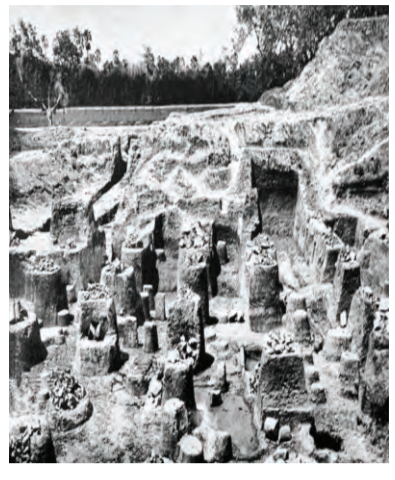
నికీ తీసుకొచ్చారు. మౌర్యుల కాలంలో అధునా తన ప్రజాశాసన విధానాలు, వనరుల అయ్యత నిర్వహణకు ఇది చారిత్రిక ఆధారాలు. ఈ ప్రాంతంలో మొట్టమొదటి పురావస్తు తవ్వకాలు 1912-1915 మధ్యకాలంలో జరిగాయి. చెక్కు చెదరకుండా ఉన్న ఒక స్తంభం, ఇతర స్తంభాల స్థానానికి గుర్తుగా 80 గంటలు, రాతి హాల్ నిర్మాణం స్పష్టం చేస్తుంది.

కప్పడు తివాచీలు, హస్తకళలు లు అంటే ముందుగా కత్తీర్ గుర్తుకొచ్చేది. కానీ, క్రమంగా అక్కడి రాజకీయ అస్థిత్వం, మత పురుషులు వంటి అనేకానేక కారణాలవల్ల కత్తీర్ తన ప్రాథమిక స్థానం కోల్పోయింది. ఇప్పుడు తివాచీ క్రమంగా అంతర్జాతీయ గుర్తింపును పొందుతున్నది. కత్తీర్, మధ్య ఆసియాకు చెందిన కళాకారుల సదస్సు చాలాకాలం తర్వాత తీసగల్గో ఇటీవల జరిగింది. వివిధ కళాకృతులు, రూపాలు సాంకేతికతక, నైపుణ్యక పరస్పర మార్పిడికి అవకాశం కలిగింది. తీసగల్గే పరస్పర మార్పిడి గుర్తింపు పరస్పర క్రాఫ్ట్ కౌన్సిల్ (డబ్ల్యుసీసీ) ఒక ప్రకటన విడుదల చేసింది. క్రీస్తుశకం 15వ శతాబ్దంలో, కత్తీర్ 9వ సుల్తాన్ జైన్ ఉల్ అబ్దీన్ ఇలాంటి సదస్సును నిర్వహించినట్లు చారిత్రిక ఆధారాలు ఉన్నాయి. అప్పట్లో సమర్పణ, బాగా, పర్షియా నుంచి వచ్చిన కళాకారుల సహాయంతో కత్తీర్లో క్రాఫ్ట్ టెక్నిక్స్ పరిచయం చేశారు. ఆ తర్వాత తీసగల్గే సాంస్కృతిక, కళావికాసం కొనసాగింది. అయితే, ఆ తర్వాత క్రమంగా క్షీణదశ మొదలైంది. 1947 తర్వాత కత్తీర్లో పరిస్థితులు మారాయి. హస్తకళలు ధ్వంసం అయ్యాయి. తాజా సదస్సు, ఒప్పందాలతో కత్తీర్ హస్తకళలకు మళ్లీ అంతర్జాతీయ గుర్తింపు రావడం ఖాయంగా కనిపిస్తున్నది. కత్తీర్కు మాత్రమే పరిమితమైన వాదనకన్న హస్తకళల నైపుణ్యాలను మధ్య ఆసియా కళాకారులు అభ్యుదయం చేస్తారు. అది విధంగా, చెక్కుపై అద్భుతంగా బొమ్మలు చెక్కే విధానాన్ని వారి నుంచి కత్తీర్ కళాకారులు నేర్చుకుంటారు. కార్పొరేషన్ యుద్ధంలో కత్తీర్ కళాకారులతో ఎవరూ పోటీపడలేరు. అలాగే వస్తున్న ఈ కళాకారుల కత్తీర్