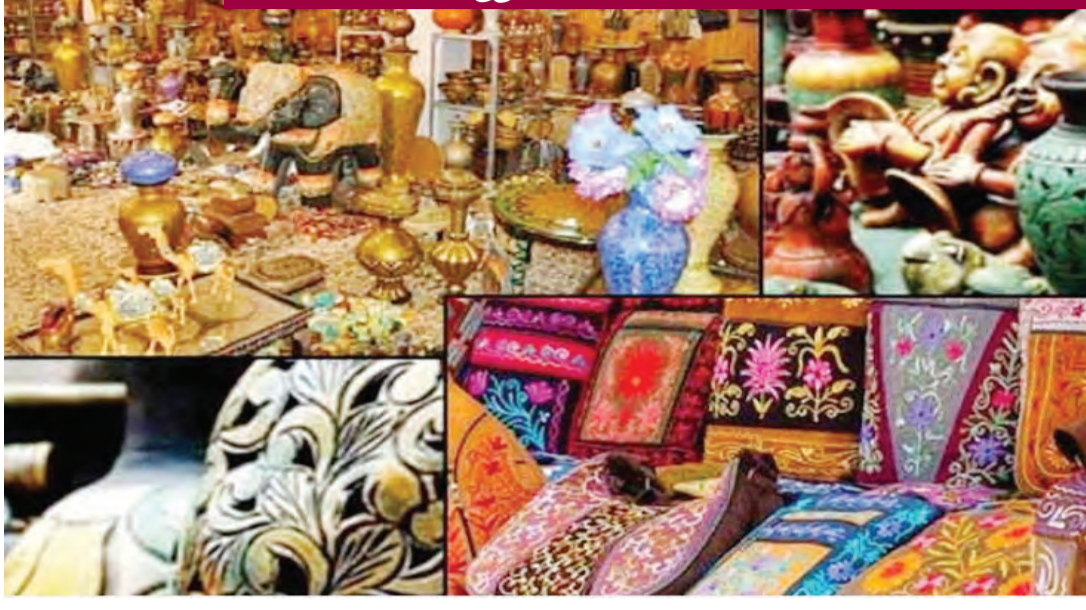
కళాకారులు మరోసారి అంతర్జాతీయ మార్కెట్లో దృష్టి సారించుతున్నారు. కత్తీర్లో దాదాపు 92 శాతం మంది కళాకారులు తమ ప్రాథమిక ఆదాయ వనరుగా చేతివృత్తులపై ఆధారపడతారు. అయితే వచ్చే ఆదాయం తరచుగా సరిపోదు, చాలా మంది వ్యవసాయం లేదా రోజువారీ కార్మికులు వంటి ద్వితీయ జీవనోపాధి ఎంపికలను చేపట్టవలసి వస్తుంది. అంతేగాక, 63 శాతం మంది మహిళా కళాకారులకు సోషల్ వంటి చేతి వృత్తుల్లో నైపుణ్యం ఉంది.

కప్పడు తివాచీలు, హస్తకళలు లు అంటే ముందుగా కత్తీర్ గుర్తుకొచ్చేది. కానీ, క్రమంగా అక్కడి రాజకీయ అస్థిత్వం, మత పురుషులు వంటి అనేకానేక కారణాలవల్ల కత్తీర్ తన ప్రాథమిక స్థానం కోల్పోయింది. ఇప్పుడు తివాచీ క్రమంగా అంతర్జాతీయ గుర్తింపును పొందుతున్నది. కత్తీర్, మధ్య ఆసియాకు చెందిన కళాకారుల సదస్సు చాలాకాలం తర్వాత తీసగల్గో ఇటీవల జరిగింది. వివిధ కళాకృతులు, రూపాలు సాంకేతికతక, నైపుణ్యక పరస్పర మార్పిడికి అవకాశం కలిగింది. తీసగల్గే పరస్పర మార్పిడి గుర్తింపు పరస్పర క్రాఫ్ట్ కౌన్సిల్ (డబ్ల్యుసీసీ) ఒక ప్రకటన విడుదల చేసింది. క్రీస్తుశకం 15వ శతాబ్దంలో, కత్తీర్ 9వ సుల్తాన్ జైన్ ఉల్ అబ్దీన్ ఇలాంటి సదస్సును నిర్వహించినట్లు చారిత్రిక ఆధారాలు ఉన్నాయి. అప్పట్లో సమర్పణ, బాగా, పర్షియా నుంచి వచ్చిన కళాకారుల సహాయంతో కత్తీర్లో క్రాఫ్ట్ టెక్నిక్స్ పరిచయం చేశారు. ఆ తర్వాత తీసగల్గే సాంస్కృతిక, కళావికాసం కొనసాగింది. అయితే, ఆ తర్వాత క్రమంగా క్షీణదశ మొదలైంది. 1947 తర్వాత కత్తీర్లో పరిస్థితులు మారాయి. హస్తకళలు ధ్వంసం అయ్యాయి. తాజా సదస్సు, ఒప్పందాలతో కత్తీర్ హస్తకళలకు మళ్లీ అంతర్జాతీయ గుర్తింపు రావడం ఖాయంగా కనిపిస్తున్నది. కత్తీర్కు మాత్రమే పరిమితమైన వాదనకన్న హస్తకళల నైపుణ్యాలను మధ్య ఆసియా కళాకారులు అభ్యుదయం చేస్తారు. అది విధంగా, చెక్కుపై అద్భుతంగా బొమ్మలు చెక్కే విధానాన్ని వారి నుంచి కత్తీర్ కళాకారులు నేర్చుకుంటారు. కార్పొరేషన్ యుద్ధంలో కత్తీర్ కళాకారులతో ఎవరూ పోటీపడలేరు. అలాగే వస్తున్న ఈ కళాకారుల కత్తీర్