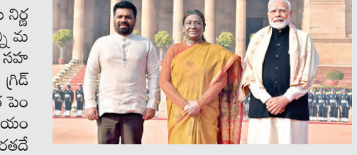
వక్షాల మధ్య పెట్టుబడి ఆధారిత వృద్ధి గురించి ప్రధాన మంత్రి నరేంద్ర మోదీ, నాకొ చెబుతూ భారత్-శ్రీలంక ఆర్థిక భాగస్వామ్యానికి తరువాతి 12%

ఇరు దేశాల మధ్య త్వరలో రక్షణ, విద్యుత్, వ్యాపార ఒప్పందాలు • జాలర్ల అంశంలో మానవత్వంతో వ్యవహరించాలి • రామేశ్వరం, తల్లిమనూర్ మధ్య ఫెర్రి సర్వీసులు భారత్ ప్రధాని మోదీ, శ్రీలంక అధ్యక్షుడు దిననాయకల నిర్ణయం న్యూఢిల్లీ : రక్షణ, విద్యుత్, వ్యాపార బంధాన్ని మరింత పెంపొందించుకోవాలని భారత్, శ్రీలంక దేశాల మధ్య నిర్ణయించాయి.