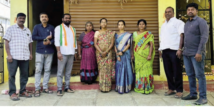
కాంగ్రెస్ నేత జంగం రమేష్ గౌడ్

ప్రజాపక్షం/గజ్వేల్: ఇందిరమ్మ పాలసలో అర్చనల ప్రతి ఒక్కరికీ ఇందిరమ్మ ఇండ్లు వర్తింప చేస్తామని కాంగ్రెస్ సీనియర్ నేత జంగం రమేష్ గౌడ్ పేర్కొన్నారు. ప్రజాపాలనలో భాగంగా ఇందిరమ్మ ఇండ్ల కోసం దరఖాస్తు చేసుకున్న వారి ఇంటింటి నర్సే నిర్వహించి లబ్ధిదారులను గుర్తించనున్నట్లు తెలిపారు. లబ్ధిదారులకు విదతల వారిగా ఇంటి నిర్మాణం కోసం రూ.5 లక్షల ఆర్థిక సాయం అందిస్తామని, గజ్వేల్ మాజీ ఎమ్మెల్యే సర్పాద్రి ఆధ్వర్యంలో సీఎం రేవంత్ రెడ్డి సహకారంతో మున్సిపాలిటీ పరిధిలోని అన్ని వార్డులలో అర్చనల ప్రతి ఒక్కరికీ ఇండ్లు కేటాయించనున్నట్లు అన్నారు. ఎన్నికల సందర్భంగా ఇచ్చిన మాట