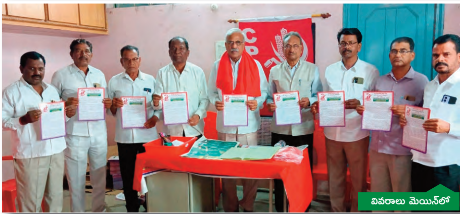
కమ్యూనిస్టులు దేశానికే దిక్కుచి