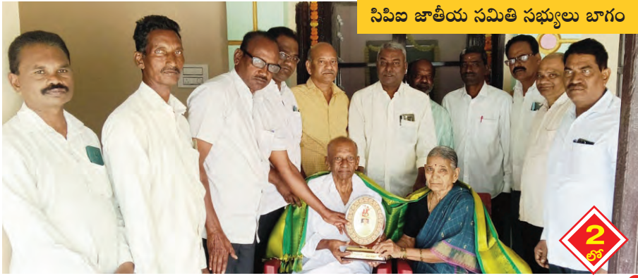
సివిజ జాతీయ సమితి సభ్యులు బాగం