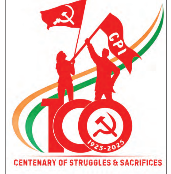
CENTENARY OF STRUGGLES & SACRIFICES

దున్నాడేటి భూమి అనే నిధానం ఉద్ధారకంగా దాల్చడంతో పాలకులకు భూ సంస్కరణల చట్టాలు తేకవచ్చలేదు. 1970 తర్వాత సీపిఐ దేశ వ్యాప్తంగా భూ పోరాటాలు ఉద్ధారకం చేసింది. దొంగ నిల్వలకు వ్యతిరేకంగా గోదాంబె దాడులు చేయబడ్డాయి. ప్రజల మాన, ప్రాణాల రక్షణకై సీపిఐ ప్రజలకు రక్షణ కవచమైంది. స్వాతంత్ర్యం సిద్ధించిన పిమ్మట కూడా రాజకీయ రాజభరణాలు చెల్లించి