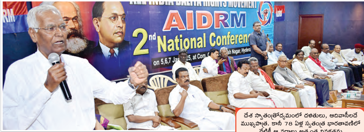
దేశ స్వాతంత్ర్యోద్యమంలో దళితులు, ఆదివాసీలదే ముఖ్యపాత్ర. కానీ 78 ఏళ్ల స్వతంత్ర భారతావళిలో నేటికీ ఆ వర్గాలు అత్యంత వివక్షతను ఎదుర్కొంటున్నాయి. దేశంలోని కల వ్యవస్థ దీనికే కారణం. దళితులు, ఆదివాసీలు లేనిదే ఈ దేశం లేదు. వారి శ్రమ ఫలితమే దేశ సంపద. - డి.రాజా