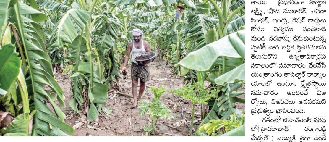
రంగారెడ్డి మేడ్చల్ ) చెయ్యికి పైగా ఉంది

విఆర్ఎ వ్యవస్థ పునరుద్ధరణ : రెవెన్యూ సంస్కరణలను కాంగ్రెస్ ప్రభుత్వం చేపట్టడంతో గ్రామస్థాయిలో పనిచేస్తున్న పాత విఆర్ఎ, విఆర్ఎ సేవలను వినియోగించుకోవాలని నిర్ణయించింది. ఈ మేరకు గతంలో పనిచేసిన 22 వేల ఉద్యోగులను తిరిగి నియమించేందుకు గాను, అనన్త కలిగిన వారు, అధ్యక్షులు ఉన్న వారు గూగుల్ పోస్ట్ దరఖాస్తులు పెట్టుకోవాలని ఏర్పాటు చేసినారు. క్షేత్రస్థాయి విఆర్ఎ, విఆర్ఎ కీలకంగా పనిచేస్తుంటారు. రెవిన్యూ గ్రామాల పరిధిలో ఎంకే విస్తీర్ణంలో ప్రభుత్వ స్థలం ఉంది. చట్ట భూములు ఏ మేరకు ఉన్నాయో, అనుసాగించే వివరాలు విఆర్ఎలకు స్పష్టంగా తెలుస్తుంది. అలాగే బీడు భూములు, అన్యత్రాణానికి గురైన వాటిపై ఎప్పటికప్పుడు అప్రమత్తంగా ఉంటారు.కాగా వీరి సేవలు ఉపయోగించుకోవాలని ప్రభుత్వం నిర్ణయించింది.వీరి ద్వారానే ఇతర ప్రభుత్వ పథకాలకు దరఖాస్తు చేసుకున్న రైతులకు ఎంపికకు సంబంధించిన వివరణలు అందుతాయి.