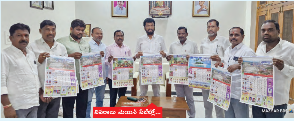
వివరాలు మెయిన్ పేజీల్లో...