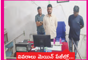
వివరాలు మెయిన్ పేజీల్లో...