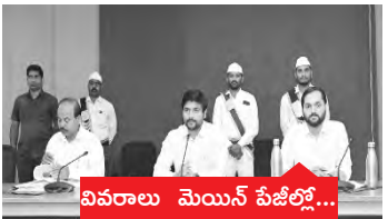
వివరాలు మెయిన్ పేజీల్లో...