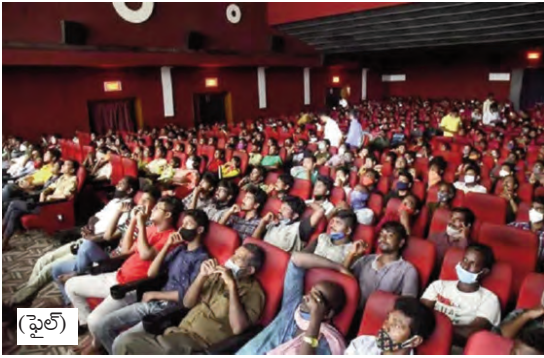
(ఫైల్) ఉక్రపాతతో ఇబ్బందు పడుతున్నారు. ఎన్ వేయమని, వసతులు సరిగా లేవని ప్రశ్నిస్తే బెదిరింపులకు దిగుతున్నారు ప్రేక్షకులు అవేవన వ్యక్తం చేస్తున్నారు. ఇప్పటికైనా స్థానిక అధికారుల స్పందించి ప్రేక్షకులను మోసం చేస్తున్న సత్యాన్ని యాజమాన్యంపై చర్యలు తీసుకోవాలని ప్రజలు కోరుతున్నారు.

ప్రజాపక్షం/మణుగూరు: పట్టణ పరిధిలోని థియేటర్ యాజమాన్యం ప్రేక్షకులకు చుక్కలు చూపిస్తుంది. కొత్త సినిమా పేరుతో భారీ డొపిడి చేస్తూ ఓకే టికెట్లకు 175 రూపాయలు వసూళ్ళు చేస్తూ... కనీస వసతుల కల్పనలో నిర్లక్ష్య దౌర్జన్య వహిస్తుందని పట్టణ ప్రజలు ఆరోపిస్తున్నారు. జిల్లా కలెక్టర్ ఆదేశాల ప్రకారం సామాన్యులకు టికెట్ ధర అందుబాటులో ఉండాలని 50 రూపాయల టికెట్లకు కూడ తప్పని సరిగా ఇవ్వాలని ఆదేశాలు ఉన్నా, థియేటర్ యాజమాన్యం మాత్రం కేవలం 175 రూపాయల టికెట్లకు మాత్రమే విక్రయిస్తూ, సామాన్యులకు సినిమా అందుబాటులో లేకుండా చేస్తుంది. అంతే కాకుండా ప్రేక్షకులకు కనీస వసతుల కల్పన కూడ యాజమాన్యం నిర్లక్ష్య దౌర్జన్య అవలంబిస్తుంది. సినిమా థియేటర్ లోని మరుగుదొడ్ల నిర్వహణ సరిగా లేక మరునాసన వెదజల్లుతున్న పట్టణమేకాక పోవటం దారలం అని ప్రేక్షకులు వాపోతున్నారు. టికెట్ ధర 175 రూపాయలు వసూళ్ళు చేస్తున్న సినిమా ప్రారంభమైన కొద్ది సేపటికే ఎన్ ఐపీవేయటంతో ప్రేక్షకులు