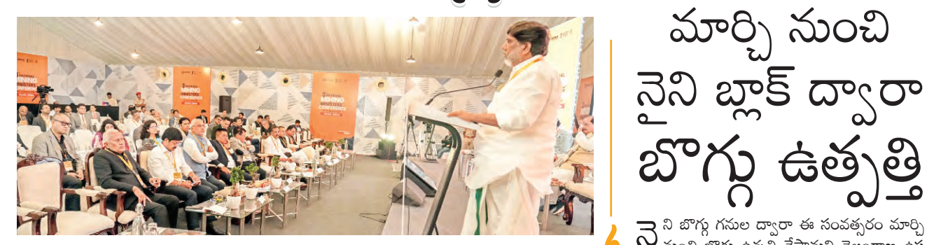
అందుకు కార్యచరణను రూపొందిస్తున్నాం

ఖనిజ నిక్షేపాలతో సమృద్ధిగా ఉన్నదని డిప్యూటీ సీఎం భట్టి విక్రమార్కు మల్లు అన్నారు. 2024-25, 2025-26 సంవత్సరాల్లో లిమ్ స్టోన్, మాంగనీస్ వంటి 32 పెద్ద ఖనిజ బ్లాకులను వేలం వేయాలని కార్యచరణను రూపొంది దిస్తున్నామన్నారు. ఖనిజాలు అధికాభివృద్ధి సమగ్ర వ్యూహంలో భాగస్వామ్యంగా ఉంటూ, దేశీయ పరిశ్రమను ప్రోత్సహించేందుకు, దిగుమతులపైన ఆధారపడడాన్ని తగ్గించేందుకు దోహద పడాలన్నారు. ఒడిషా రాష్ట్రంలోని కోబార్లో సోమవారం జరిగిన '3వ జాతీయ ఖనిజ మంత్రుల సమావేశం'లో డిప్యూటీ సీఎం భట్టి విక్రమార్కు హాజరై, ప్రసంగించారు. 2015 నుండి ఇప్పటి వరకు రూ.5.537 కోట్లను తరువాయి 2లో