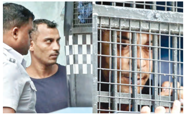
కోల్కతా : అరెస్టాల్లో ఉన్న వైద్యులకు అనుమతిలో విధి

దావోస్లో జరుగుతున్న ప్రపంచ ఆర్థిక సదస్సుకు తెలుగు రాష్ట్రాల నుంచి ఇద్దరు ముఖ్యమంత్రులు హాజరయ్యారు. జ్యూరిచ్ చేరుకున్న ఎపి సిఎం చంద్రబాబు, మం త్రులు, అధికారుల బృందం, అదే ఎయిర్ పోర్టులో అప్పటికే అక్కడ ఉన్న తెలంగాణ సిఎం రేవంత్ రెడ్డి, మంత్రుల బృందం ముద్రాపత్రాలు ర్వకంగా కలిసింది. ఇరు రాష్ట్రాల ముఖ్యమంత్రులకు అక్కడి ప్రవాస తెలుగు ప్రజలు ఘనంగా తరువాయి 2లో