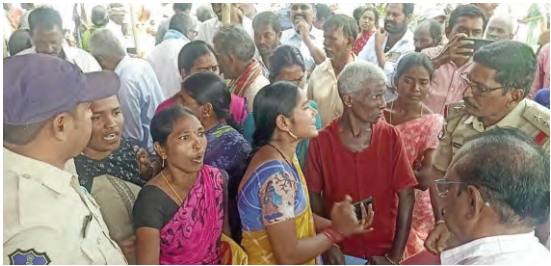
- అనర్ధుల ఎంపిక పట్ల ఆగ్రహం - అర్ధులను ఎందుకు ఎంపిక చేయలేదంటూ నిలదీసిన గ్రామస్తులు

ప్రజాపక్షం/వైరా : వైరా మండలం రెబ్బవరం గ్రామంలో ప్రత్యేక అధికారి కష్టాల సత్యనారాయణ అధ్యక్షతన జరిగిన ప్రజా పాలన గ్రామ సభ రసాభాసగా మారింది. ఒక్కసారిగా గ్రామ ప్రజలు అధికారులపై ఆగ్రహం వ్యక్తం చేసి నిలదీశారు. గ్రామంలో ఎంపిక చేసిన లిస్టులలో అర్ధులకు చోటు లేకుండా అసహాయాలను ఎంపిక చేశారని తీవ్ర ఆగ్రహంతో గ్రామసభ అధికారి వద్దకు తోసుకొని వెళ్లారు. మహిళలు తీవ్ర ఆగ్రహంతో ఎవరు ఎంపిక చేశారు. ఎవరు లిస్టులు ప్రకటించారు అంటూ నిలదీశారు. ఇందిరమ్మ భరోసా ఆత్యయ భరోసా కార్యక్రమంలో భూమిలేని నిరుపేదలకు ఉపాధి హామీ పనికి వెళ్లే వారికి సంవత్సరానికి 12000 రూపాయలు అందిస్తామని లబ్ధిదారులు ఎంపిక జరుగుతుందని చెప్పిన ప్రభుత్వం ఇందిరమ్మ ఆత్యయ భరోసా ఎంపికలో పూర్తిగా భూములు ఉన్న వారికే ఇందిరమ్మ ఆత్యయ భరోసా పథకం