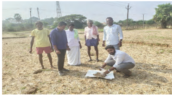
అవసరం మేరకు వాడుకునే సౌలభ్యం రైతులకు తెలిసినప్పుడు సాగు ఖర్చును గణనీయంగా తగ్గించవచ్చని అన్నారు. ఈ కార్యక్రమంలో రైతులు పాల్గొన్నారు.

లేదా రైతులు 500 గ్రామాల మట్టి శాంపిల్స్ ను ఏఈఓ లకు రైతుల వివరాలతో అందజేయాలని, ఎర్ర నేలలు, నల్ల నేలలు, సాధు భూములు, ఏ భూములుంటే ఆ భూములకు సంబంధించిన మట్టి శాంపిల్స్ ను వేరువేరుగా సేకరించాలని, మనిషి ఆరోగ్యాన్ని తెలుసుకోవడంలో రక్త పరీక్ష ఎలా ఉపయోగపడుతుందో, నేల పోషక విలువలు గురించి తెలుసుకోవడానికి మట్టి నమూనా పరీక్ష అలా ఉపయోగపడుతుందని, నేల స్వభావం రైతుకు తెలిసి వచ్చు దానికి తగ్గ పోషకాలను, సేంద్రియ ఎరువులను, రసాయన ఎరువులను