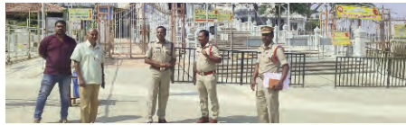
కాశం ఉన్నందున భక్తులకు ఎలాంటి ఇబ్బంది కలగకుండా పటిష్టమైన బందోబస్తు ఏర్పాటు చేస్తున్నట్లు తెలిపారు. కాగా భక్తులు పోలీసుల సూచనలు, సలహాలు పాటించి ప్రశాంతంగా అమ్మవారిని దర్శించుకుని వెళ్లాలని సూచించారు. ఏదైనా సంఘటన జరిగితే వెంటనే తమ దృష్టికి తేవాలని వివరించారు.