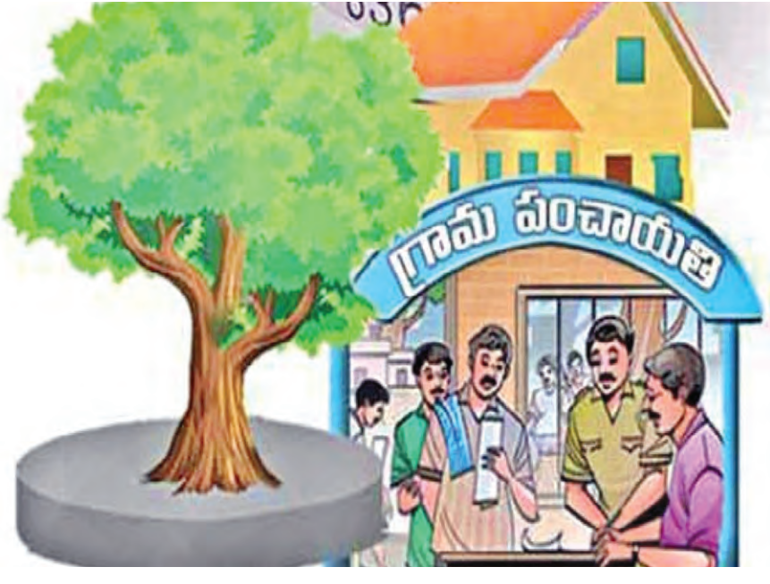
కొందరు ఓ అదుగురు ముందుకేసి గ్రామ పంచాయతీ పరిధిలో తనను సర్పంచ్ గెలిపిస్తే గ్రామంలో జరిగే ప్రతి

ప్రజాపక్షం/ఖమ్మం : ‘ఎన్నికల సందర్భంగా ప్రజలు అడిగినవి అడగనివి కలిపి హామీలు ఇస్తారు. సమ్మి గెలిస్తే హామీలు నెరవేర్చేందుకు ప్రయత్నిస్తారు. ఓడిపోతే సమ్మి ఓటు చేయని ఓటర్లకు తప్పించి, ఒకవేళ సమ్మి ఓటిస్తే హామీలు అమలు చేయలేదని పదవినీ వెనక్కు తీసుకుపోలేదా’ అని ఓ రాజకీయ నేతగా వ్యాఖ్యానించిన చిన్నట్లూ గెలుపు, ఓటమి తర్వాత సంగతి గ్రామ పంచాయతీ సర్పంచల ఆశావాహనలు మాత్రం ఇది అదే అని తేడా లేకుండా వాగ్దానాలు వర్షం కురిపిస్తున్నాయి. జాతీయ, రాష్ట్ర స్థాయి ఎన్నికలను మించి వాగ్దానాలు చేస్తున్నారు. సాధారణ ఎన్నికలను తలపిస్తూ గ్రామాలకు వర్షాల వారీగా ఏమీ చేసేమో ప్రకటిస్తున్నారు. రాష్ట్ర ప్రభుత్వం ఖిల్లవరి మూడవ వారంలో స్థానిక సంస్థల ఎన్నికలకు నోటిఫికేషన్ పంపిందని చర్యలుగా వెల్లడించిన సేవధ్యంలో ఆశావాహనలు గ్రామంలో ప్రచారం ప్రారంభించారు. సిస్టెమ్ మెన్టల్ వరకు రిజిస్ట్రేషన్ గురించి చర్చించిన వారు సైతం సానుకూల రిజిస్ట్రేషన్ పనే పంపిందని భావించి ఇల్లు ఇల్లు తిరుగుతూ వాగ్దానాలు చేస్తున్నారు. గ్రామాల్లోని అంతర్గత రోడ్లను సొంత భర్తలతో నిర్మిస్తామని కొందరు, డ్రైనేజీలు నిర్మిస్తామని, పాఠశాలలకు, దేవాలయాలకు పెద్ద మొత్తంలో వితరణ చేస్తామని ప్రజలకు హామీలు ఇస్తున్నారు. మరి