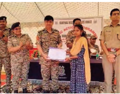
ఫౌండేషన్ వారికి ప్రత్యేక ధన్యవాదాలు తెలిపారు.