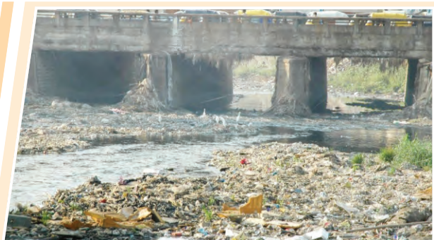
కాలుష్యం ఉచ్చలో 'హిండస్'

కప్పుడు ఉత్తరప్రదేశ్ లోని పలు కీలక ప్రాంతాల్లో వ్యవసాయానికి, మత్స్య సంపదకు ఎంతగానో ఉపయోగపడిన హిండస్ నది నేడు కాలుష్యమయమైంది. శుద్ధి చేయని వ్యర్థాల కాలుష్యం హిందస్ నది పరిణామం వ్యూహంపై దృష్టి నివేదిక ప్రకారం... ఈ కాలుష్యం పశ్చిమ ఉత్తరప్రదేశ్ లోని పారిశ్రామిక బెల్ట్ లో ఉన్న సమాజాలను ప్రమాదంలోకి నెడుతున్నది.