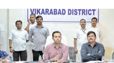
గ్రామంలో ముగ్గురు చొప్పున 15 బృందాలను 45 మంది మహిళలను ధారాద్, బోమ, వికారాబాద్, మర్చర్ల, మండలాల్లోని మహిళా సంఘాలకు సీఆర్ఐలు జిల్లాలో మహిళా సంఘాల ఏర్పాటు చేయాలని తెలిపారు.

కలెక్టర్ ప్రతీకెకెన్ ప్రజాపక్షం/వికారాబాద్ ప్రతినిధి: మహిళా స్వయం సహాయక సంఘాల అభివృద్ధికి నిరంతరం కార్యక్రమాలు నిర్వహించాలని వికారాబాద్ జిల్లా కలెక్టర్ ప్రతీకెకెన్, కలెక్టర్ కార్యాలయంలో ఏర్పాటు చేసిన సీఆర్ఐ మహిళలతో మాట్లాడారు. మహిళా సంఘాల బలోపేతంకు సీఆర్ఐ వ్యూహం కార్యక్రమం జిల్లాలో ప్రారంభిస్తున్నట్లు ప్రకటించారు. సీఆర్ఐలు మహిళా సంఘాలను గ్రామాల్లో బలోపేతం చేయాలని తెలిపారు. ఒక