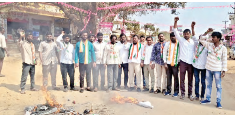
చిన విధంగానైనా ఈ బడ్జెట్లో నిధులు కేటాయించకుండా కోతలు విధించి ప్రజా వ్యతిరేక బడ్జెట్లో దోపిడీ వర్గాల పాలకులుగా నిరూపించుకున్నారు అనేదే వ్యక్తం చేశారు. వ్యవసాయ రంగాన్ని సంక్షేమం నుంచి గట్టి క్లింపేందుకు నిధులు పెంచాల్సింది, పోయి సబ్సిడీలు తగ్గించారని జాతీయ గ్రామీణ ఉపాధి సహకార పాఠశాలకు ఉపాధి డైరెక్టర్, కుండా బడ్జెట్లో కోత విధించాలని పంపిణీ నియంత్రణకు బడ్జెట్ కేటాయింపులే లేవని