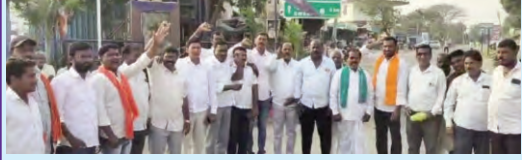
ప్రజాపక్షం/సారంగాపూర్ : ఢిల్లీలో బిజెపి భారీ మెజార్టీతో గెలవటంతో సారంగాపూర్ అంబేద్కర్ కూడలి లో ఆ పార్టీ నాయకులు శనివారం సంబరాలు జరుపుకున్నారు. ఈ సందర్భంగా బాణసంచాలు పేల్చి, స్పీట్లు పంచుకున్నారు. గతంలో ఆప్ తప్పుడు హామీ లిచ్చి అవినీతిమయమైపోయిందన్నారు. ప్రజలను మోసం చేసిన అమ్మి ఢిల్లీ ప్రజలు తిరస్కరించారని అన్నారు. ఈ సందరాల్లో బిజెపి సీనియర్ నాయకులు పాల్గొన్నారు.