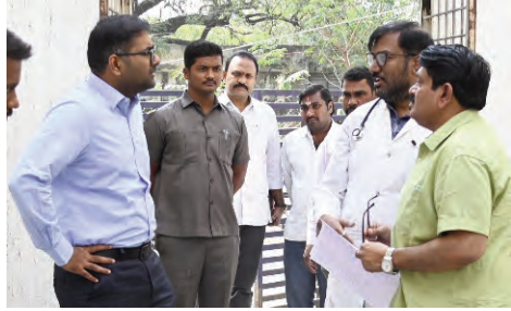
డించాలని అధికారులకు కలెక్టర్ సూచించారు.అనంతరం జిల్లా కలెక్టర్ బొంపల్లి పెద్దగుట్ట లోని మిషన్ భగీరథ ఇంట

(1వ పేజీ తరువాయి) కలెక్టర్ మాట్లాడుతూ పెద్దపల్లి పట్టణంలో 57 కోట్లతో నూతన ఆసుపత్రి భవనం నిర్మించేందుకు గాను పాతపడిపోయిన ఆసుపత్రి కూల్చివేయాలని ప్రభుత్వం నుంచి ఆదేశాలు వచ్చాయని, పాత భవనంలో ఉన్న ఓపి కాంప్లెక్స్, డయాలసిస్ యూనిట్లను ఎంసిహెచ్ ఆసుపత్రి లోకి తరలించాలని కలెక్టర్ తెలిపారు.ఎంసిహెచ్ ఆసుపత్రి పరిశీలించిన కలెక్టర్ ఎక్కడ ఓపి కాంప్లెక్స్, డయాలసిస్ యూనిట్ ఏర్పాటు చేసే అవకాశం ఉందో పరిశీలించి 3 రోజుల్లో తుది ప్రణాళిక తయారు చేయాలని, తరలింపు ప్రక్రియ చేపట్టి పాత భవనం కూల్చివేత పనులు ప్రారంభమయ్యేలా కార్యాచరణ రూపొందించాలని అధికారులకు కలెక్టర్ సూచించారు.అనంతరం జిల్లా కలెక్టర్ బొంపల్లి పెద్దగుట్ట లోని మిషన్ భగీరథ ఇంట